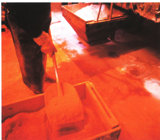
Så här gick mängblandning till fram till 1979.

Glasma byggdes 1979 som en gemensam satsning på en mängblandningsanläggning av flera svenska glasbruk för att lösa de miljöproblem som fanns ute på bruken, framför allt när det gällde bly, men även arsenik m m.