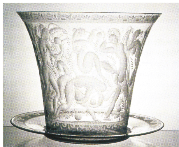
Bollspelande flickor, ritad av Ewald Hald, graverad av Börje 1996

Som den skickliga yrkesman han är, har Börjes kunskaper inte bara utnyttjats hemmavid.