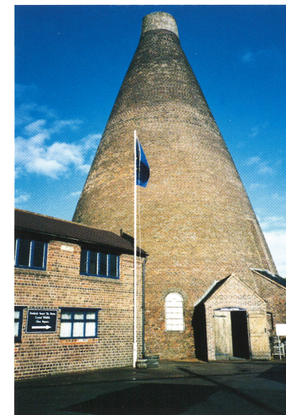
Museihytta i det engelska glasriket. En rundugn står i mitten och hela hyttan är konformad och öppen från botten till topp

På torsdagen var jag på Stuart Crystal där jag träffade en degelmakare som visade mig runt på glasbruket. Deras degeltillverkning omfattar ca 30 deglar per år. Trenden på alla tre glasbruken var dock att man gärna vill ha den tyska leran i sina deglar, vilket är den typ av lera vi använder oss av i degelverkstaden i Orrefors där jag tillbringar mina arbetsdagar i vanliga fall.