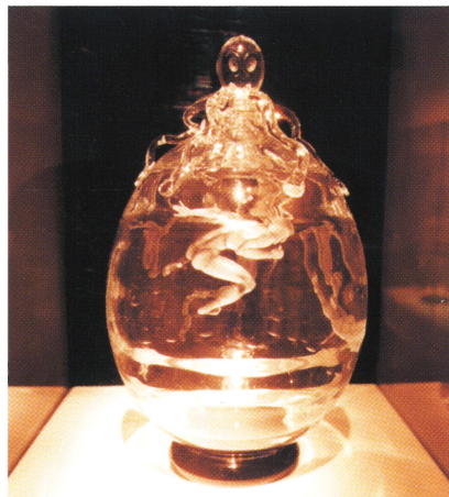
Bilden ovan: En av pjäserna i Bardutställningen. Pärlfiskare, tillverkad på Orrefors 1931 och formgiven av Vicke Lindstrand. Ägs nu av Nationalmuseum i Stockholm.