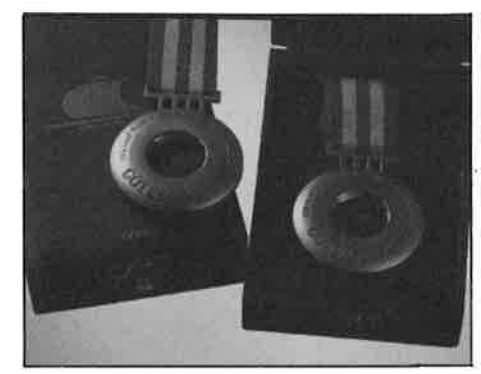
Guldmedaljen. I metallcirkelns centrum kristall som innesluter en bubbla svensk luft. En extra hälsning från Sverige som medaljörerna får med sig hem efter VM.

Medaljerna kommer att ingå i vårens reklammaterial för Orrefors varumärke.