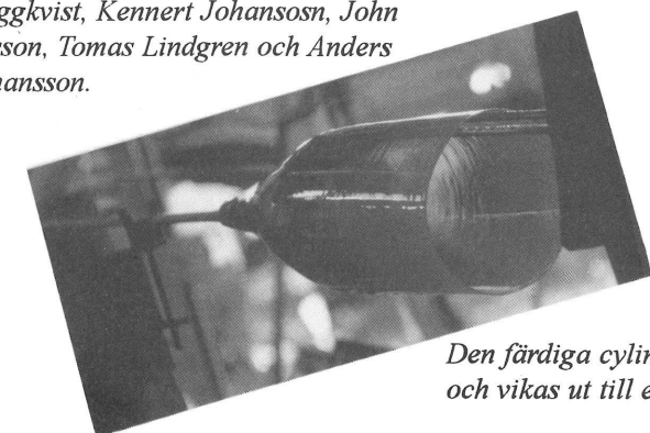
Den färdiga cylindern som ska ritsas och vikas ut till en skiva