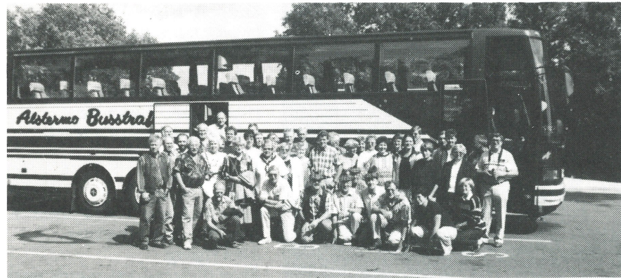
Ett glatt gäng från Kosta, rastade vid Rehn och Lorelei-klippan