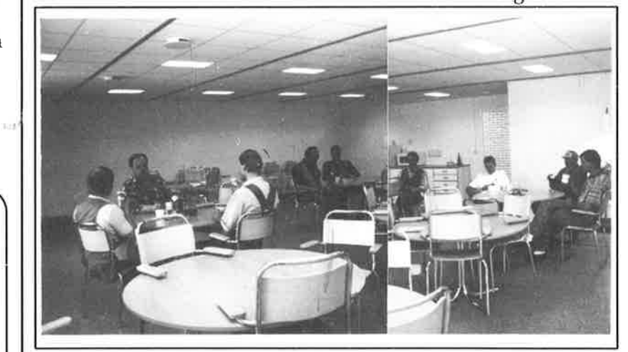
Fikapaus hos underhållsgänget. Lokalen passar också bra att använda vid utbildningar. ISO-grupper håller redan till här med sin utbildning.

Resultatet är ljusa och rymliga lokaler. Fyra kontorsarbetsplatser i ett rum, ett litet konferensrum, ett stort pausoch utbildningsrum, lokaler för underhåll, el, mek.verkstad, järnformverkstad och sprutlackering ryms i de nya lokalerna.