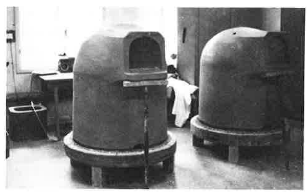
Här syns snabeln före och efter det leran skurits ut, samt bryggan vid anfångshålet

När kupen är nästan färdig, får degeln åter vila en natt. Man har lämnat ett hål på toppen och det stänger man nu och efter en timma gör man den s k snabeln, för anfångshålet.