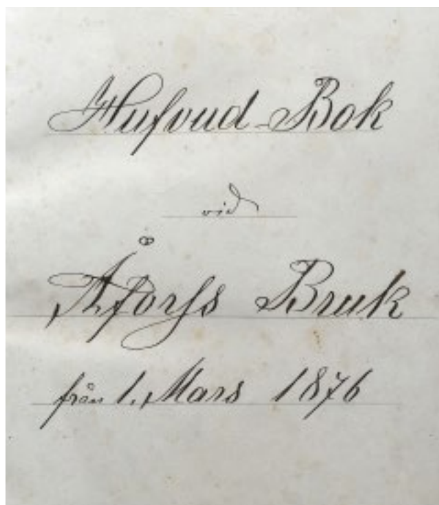
Huvudbok från brukets allra första år 1876.

Under Stor-Kalles tid tillverkades vardagsprodukter som