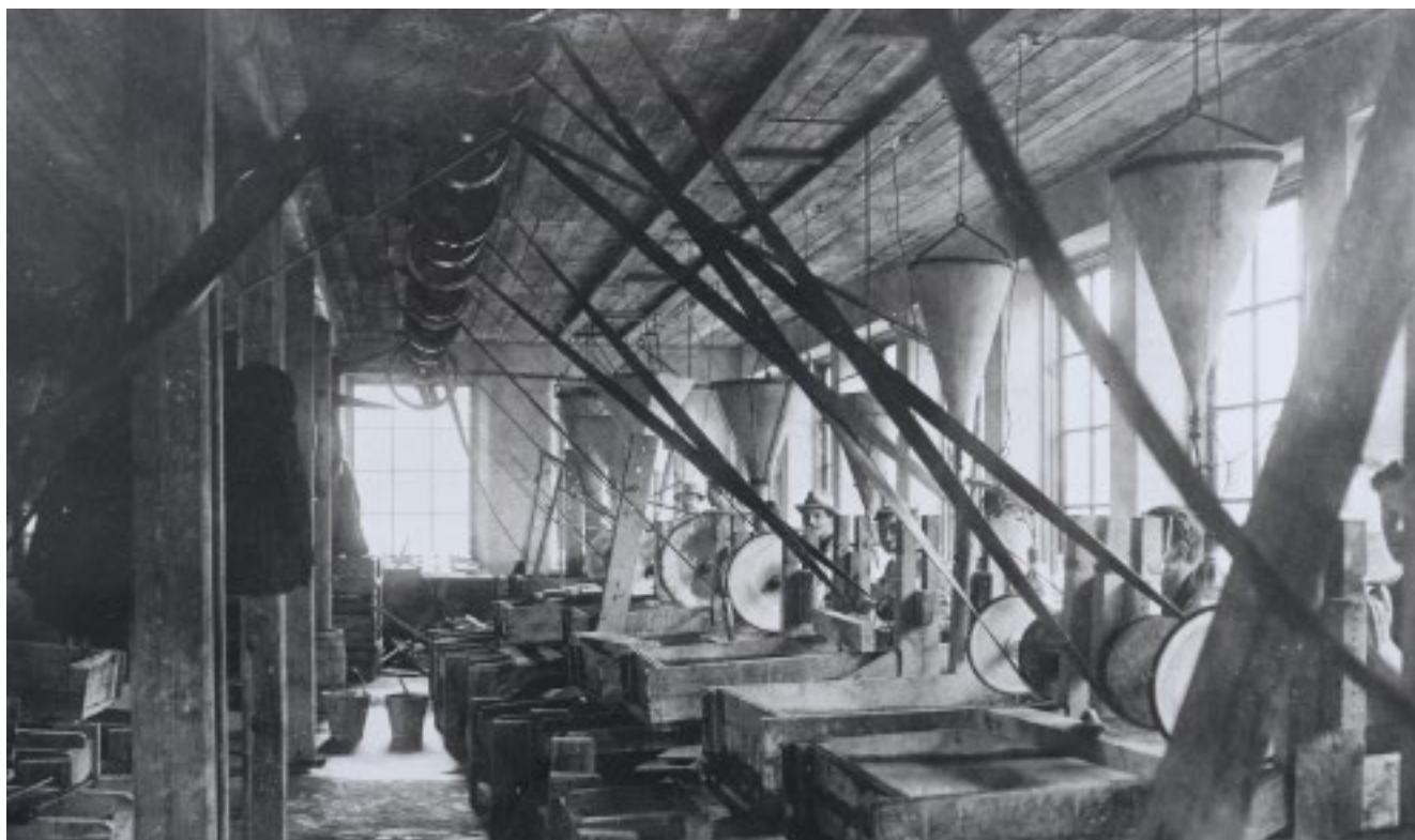
Sliperiet i Åfors vid 1930-talets början.

handdragna vagnar på räls, men när bruket elektrifierades fanns ingen anledning att hålla fast vid kvarndriften vid ån. 1922 flyttade sliperiverksamheten hit till nybyggda lokaler.