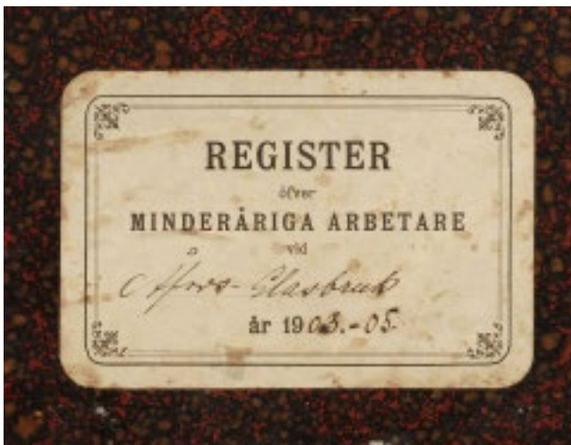
Det var många barn som arbetade inom glasindustrin för hundra år sedan.