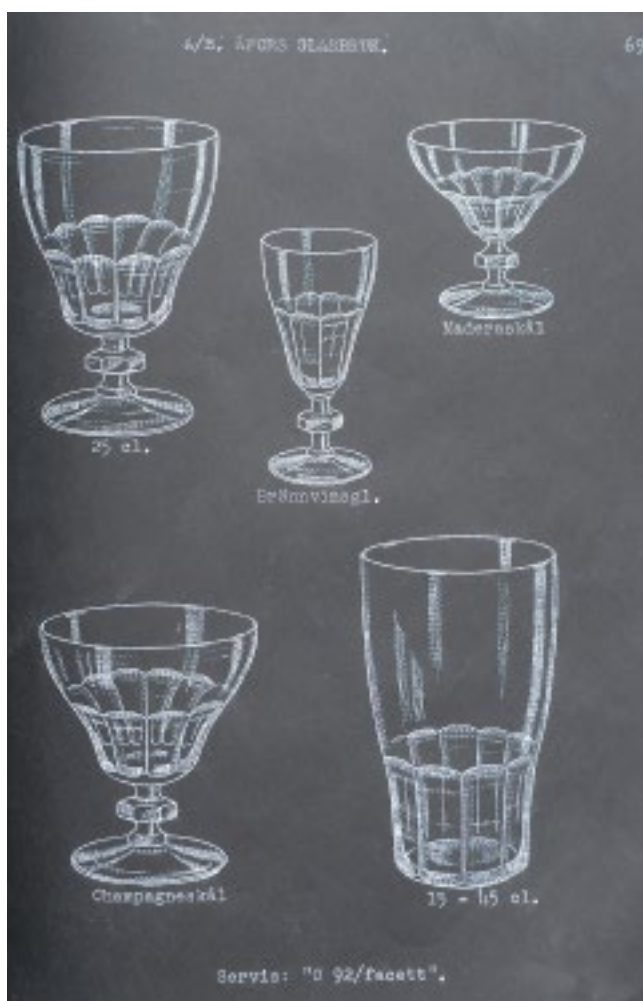
Servisglas ur 1930-talets sortiment.

uppsving under 1920-talet, då hushållsglasets stil började förändras åt det funktionella hållet. På 1930-talet vek marknaden men glasmåleriet drevs vidare, liksom i Johansfors och Hovmantorps nya glasbruk. En produkt i tiden var då de så kallade bilvaserna, smala blomhållare med slipad dekor för eleganta bilinteriörer.