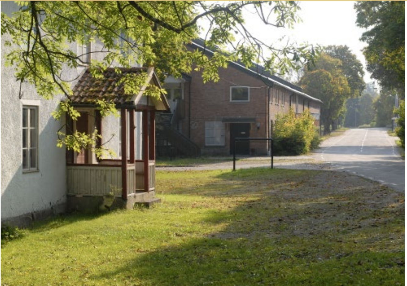
Fina stugan och hyttan.