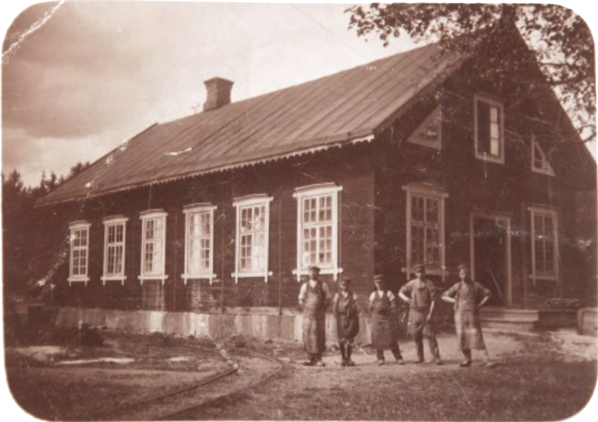
Första sliperiet intill ån, fotograferat kring sekelskiftet 1900.