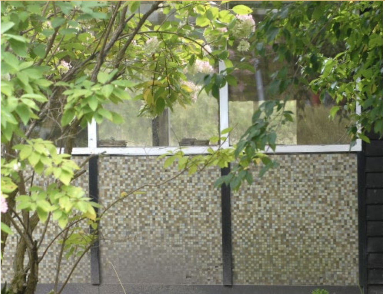
Detalj av Bruno Mathsson-huset i Åfors.