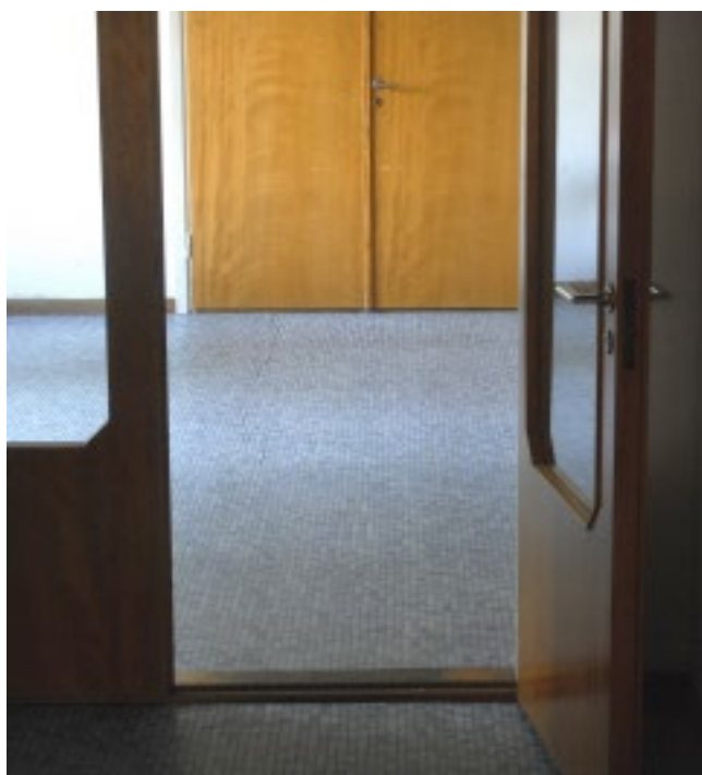
Golvet av glasmosaik från Kosta ligger kvar i Åfors Folkets hus.

åren har många kända underhållare stått på scenen. Senare har bottenvåningen använts som ungdomsgård av Emmaboda kommun. Filmvisningen har sedan 1980-talet varit sporadisk, men fick en markant topp 1985. Då premiärvisades här Lasse Hallströms film Mitt liv som hund , som delvis spelats in i Åfors.