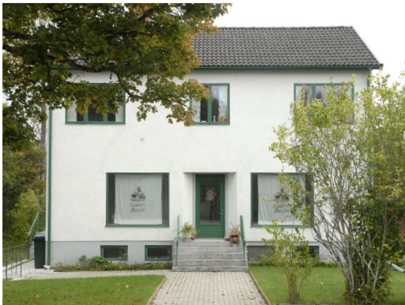
Konsumhuset idag.