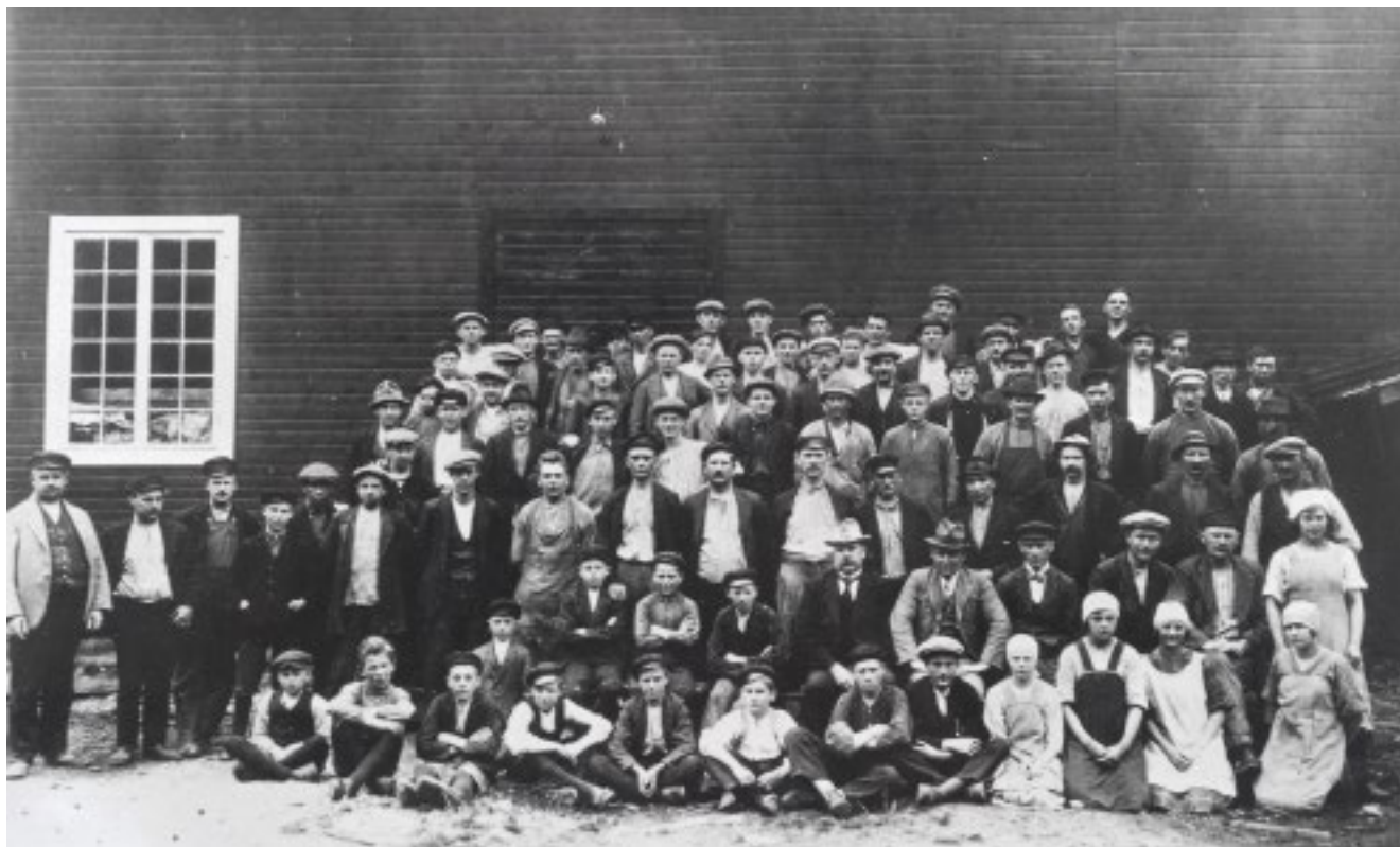
Brukets arbetsstyrka vid början av 1930-talet.

På Åfors var man också tidigt ute med målad dekor på skålar och karaffer. Måleriet liksom slipningen fick ett