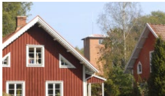
Bostadshus vid Potatisgatan med brandstationen i bakgrunden.

Strax därefter skänktes ytterligare tomter längs en tvärgata norr om hyttan och ett nytt egnahemsområde växte upp. Sammanlagt bodde ett sextioal personer i husen, som alla till