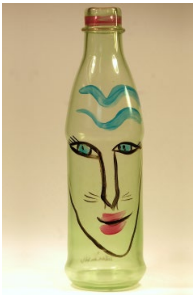
PET-flaska, formblåst målat glas av Ulrika Hydman-Vallien 2002.

Det nya framtidsinriktade Åfors lockade andra formgivare till sig och i slutet av 1980-talet kom bland andra Gunnel Sahlin från Kosta. Hon gjorde sig framför allt känd med sina färgglada frukter och Amazonkannor. År 2000 flyttade Olle Brozén till bruket och tillförde ytterligare dimensioner till konstglaset, med graalvaser, bilar och Floating Flowers.