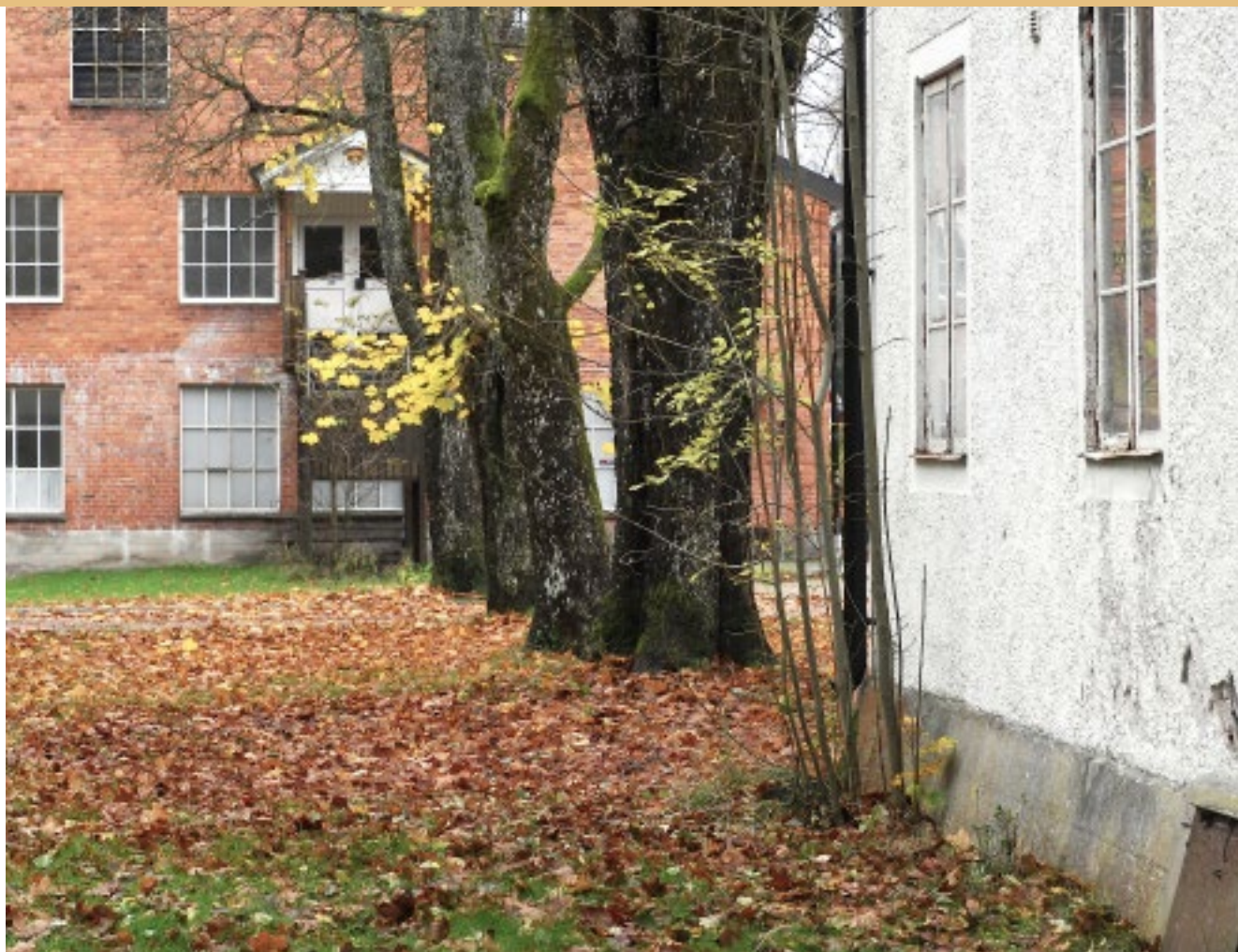
Fina stugan med hytta och sliperi i bakgrunden.