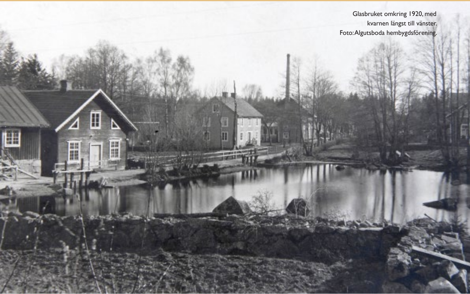
Glasbruket omkring 1920, med kvarnen längst till vänster.