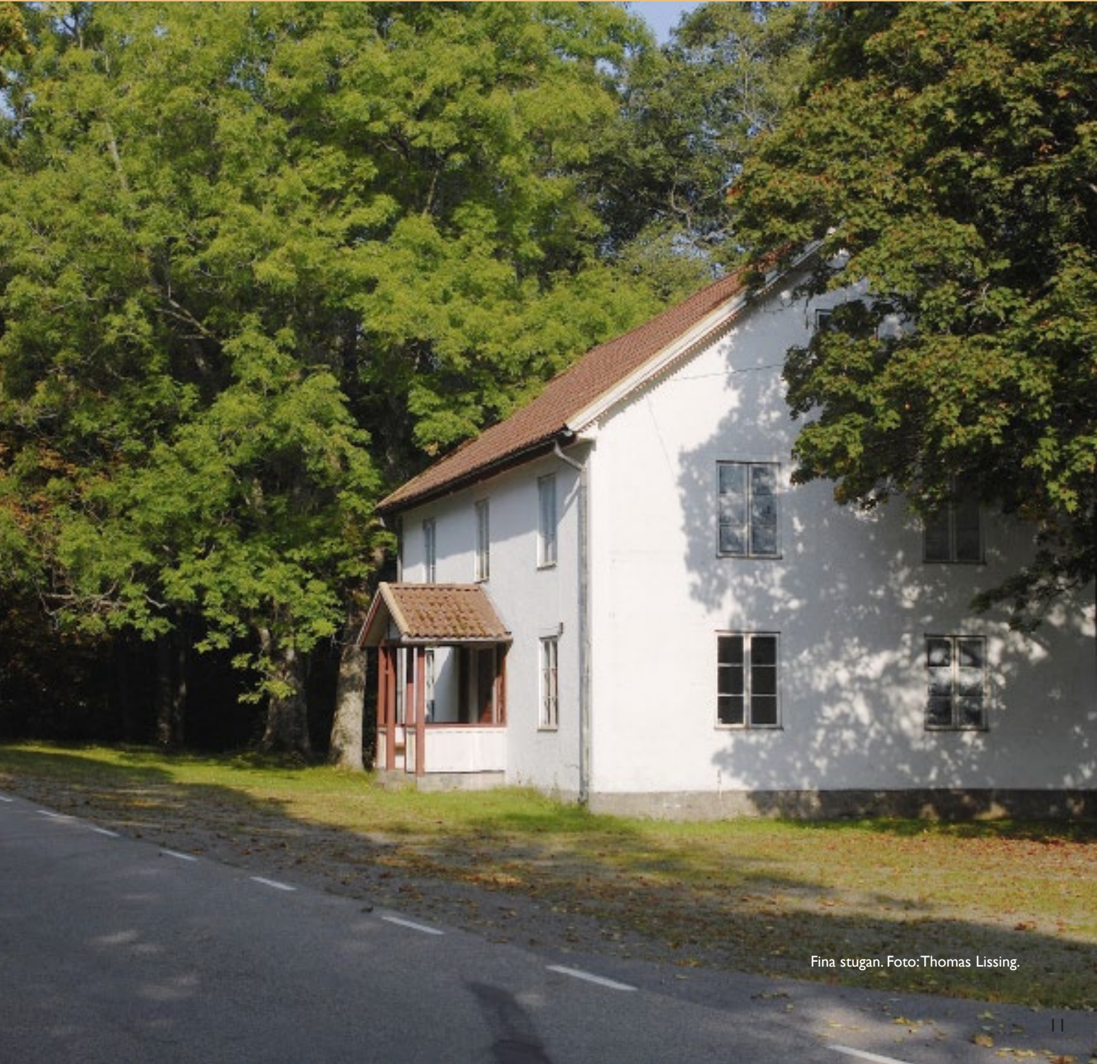
Fina stugan.