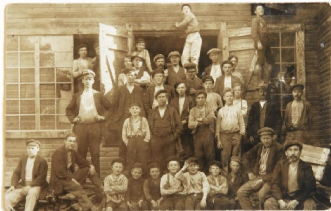
Arbetslag i Åfors omkring 1930.