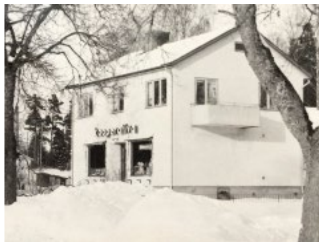
Kooperativa i Åfors.

Det långa cykelstället i affärslokalens staket påminner om den tid då man tog cykeln till den närbutik man var delägare i.