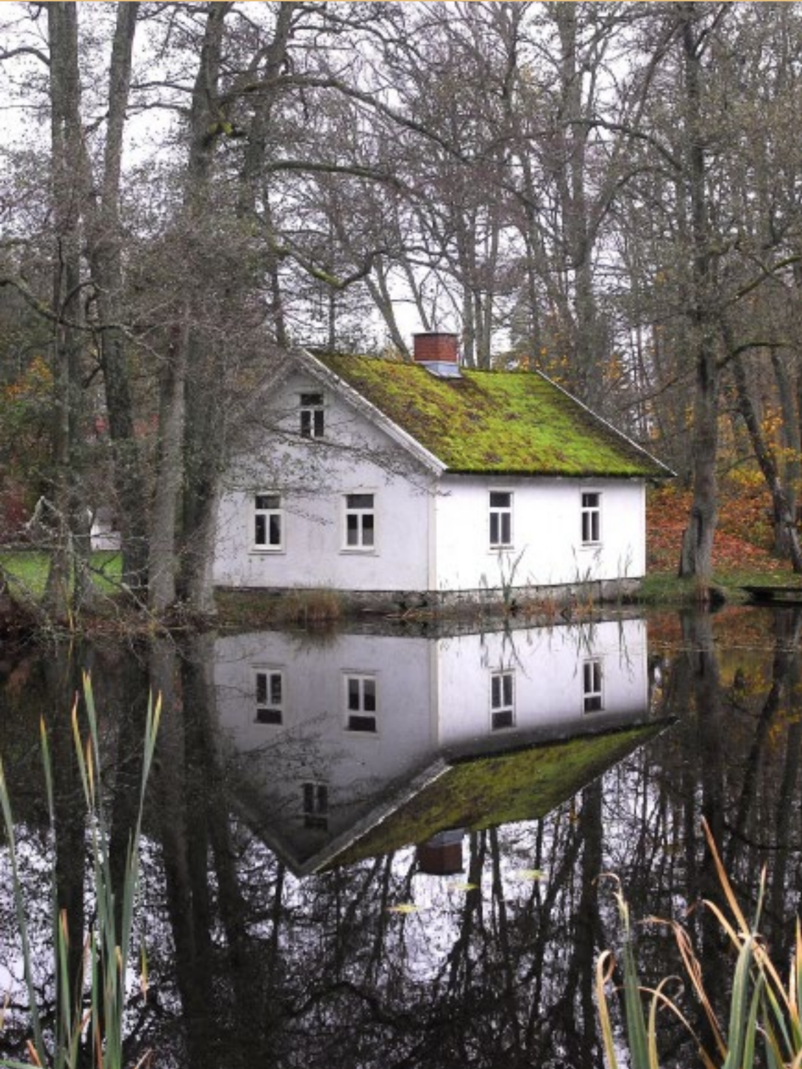
Mjölkboden intill Lyckebyåns damm.