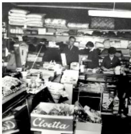
I brukshandeln på 1960-talet.

Brukshandeln drevs i olika regi vidare in på 1980-talet.