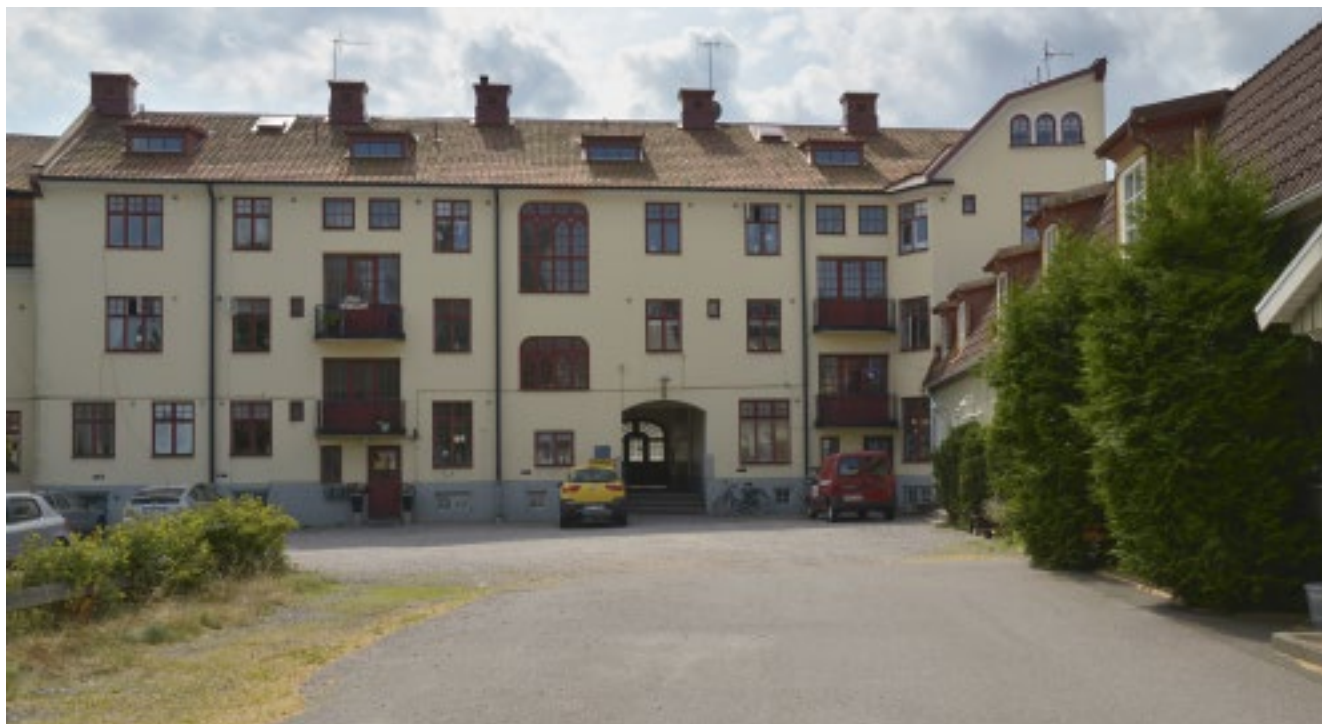
Ljungdahlska bokhandeln – från gården och trapphusen.

Ljungdahlska bokhandeln som 1904 återuppbyggdes efter en brand. Huset utfördes i en sirlig jugendstil med svängda bur-språk och krökta trappor, räcken och balkonger. Ljungdahlska bokhandeln fick flera efterföljare och flera hus byggdes eller byggdes om i samma stil.