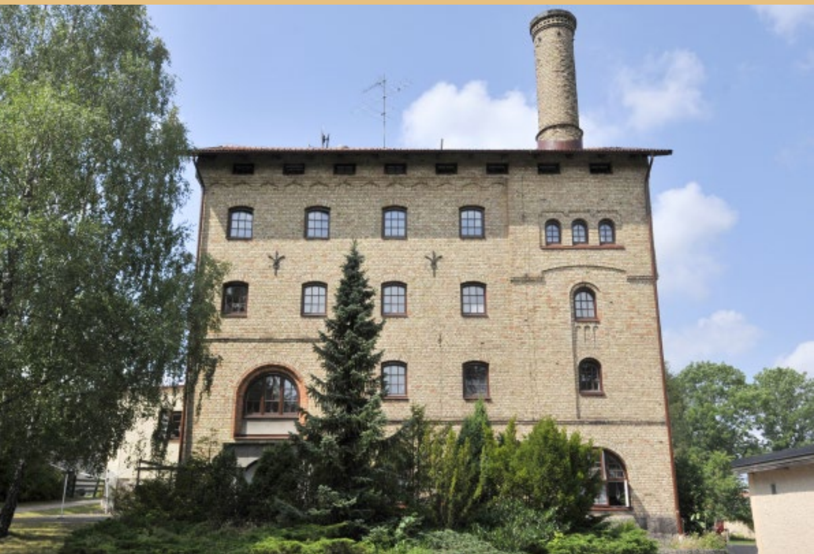
Grönskogs bryggeri, ett bayerskt bryggeri grundat 1860 i Nybro.