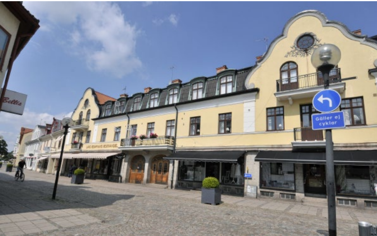
Exempel på Nybrojugend, en elegant och festlig fasad med volutprydda dekorgavlar och för tiden typiska ornament med former från växtriket.