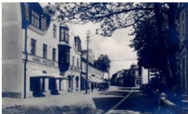
Storgatan i Nybro på 1920-talet.