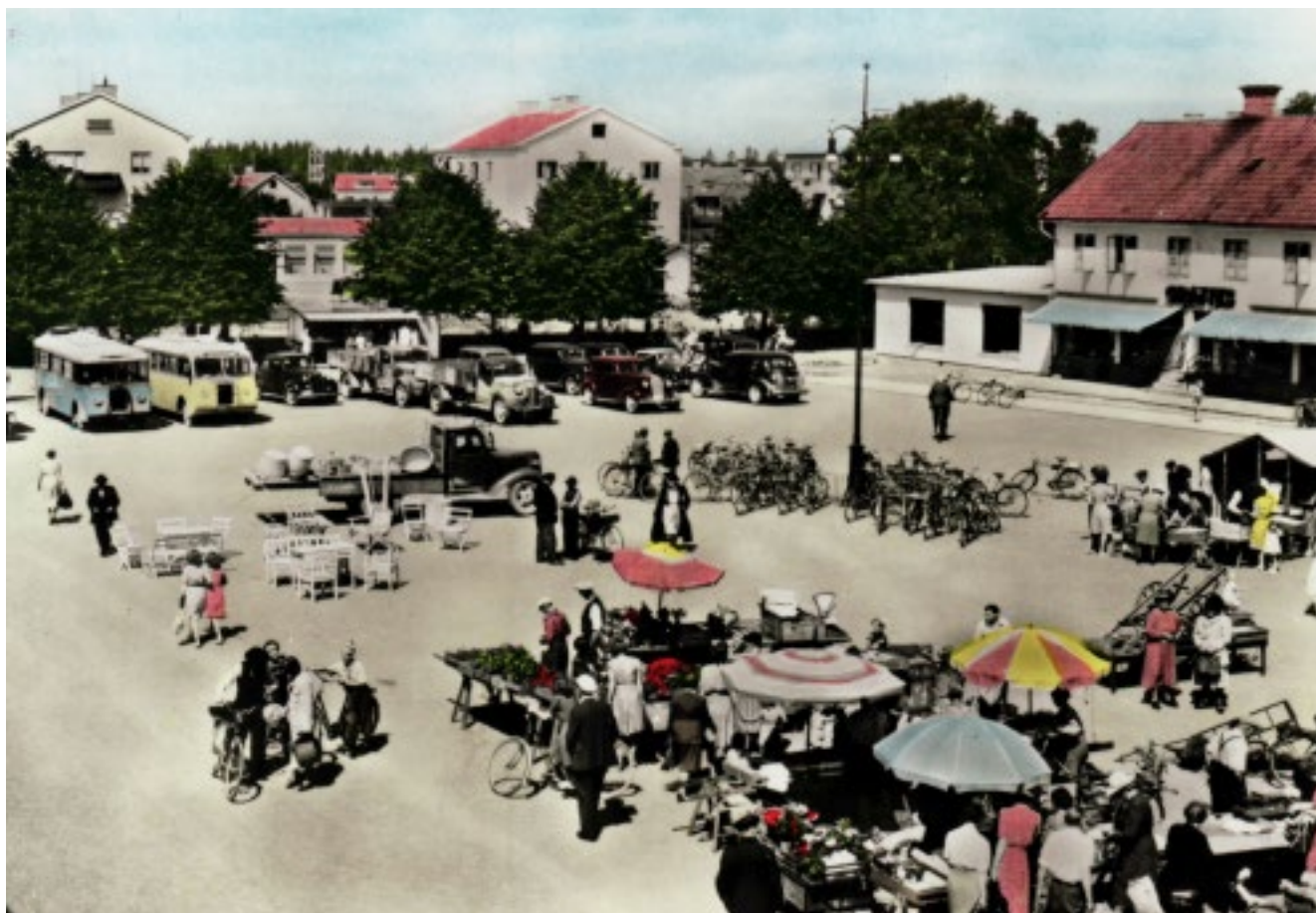
Torghandel ca 1940. Handkolorerat vykort.