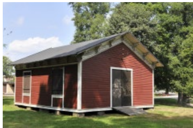
Tallhyddan. En av de få kvarvarande byggnaderna från kurortstiden.

1883 öppnade kurorten Nybro kallvattenanstalt. Efter mönster från andra kurorter planerade och uppförde framförallt byggmästare Blomdell ett stort antal kurortsbyggnader med rik snickarglädje; här fanns bland annat saltbod, varmbadhus, vattenpaviljong, kallbadhus, vattenkiosk, växthus och hängmattsskjul. Tyvärr är de flesta husen rivna. Skogshyddan är tillsammans med några badhusvillor de enda bevarade byggnaderna från brunnsepoken.