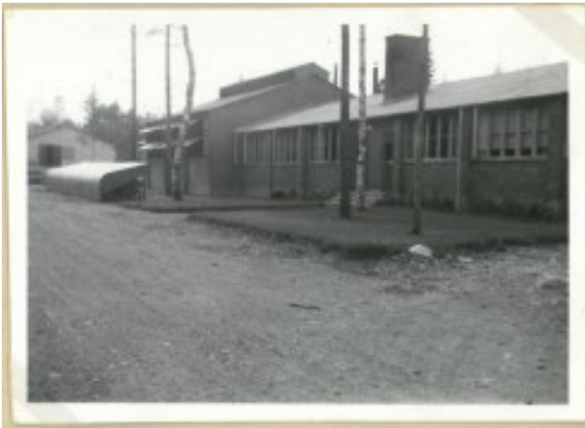
Den nya fabriken uppförs i tegel.