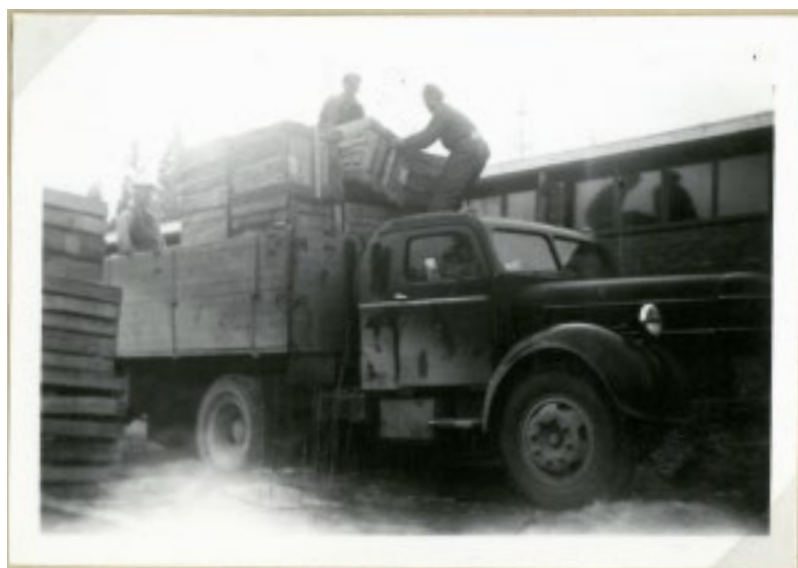
Lastning av glasvaror på Nybro glasbruk. Bruket hade en egen lådsnickare.

Nybro Glasbruk är det enda i Glasriket som varit familjeägt i tre generationer. Som ett litet kuriosum kan nämnas att bruket levererade priser till de olympiska vinterspelen såväl i amerikanska Lake Placid 1980 som till Sarajevo 1984.