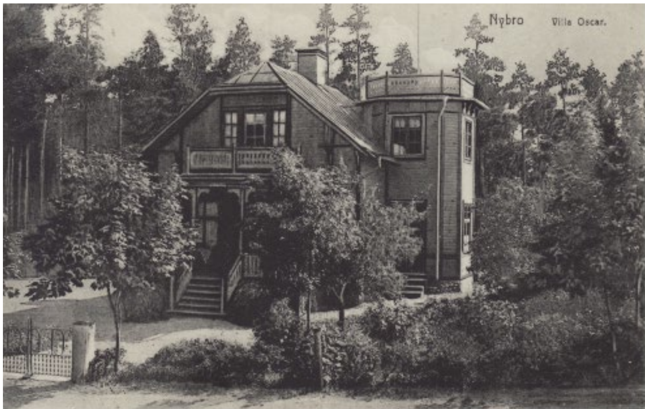
Villa Oscar ca 1910. En av badhusvillorna från kurortstiden.