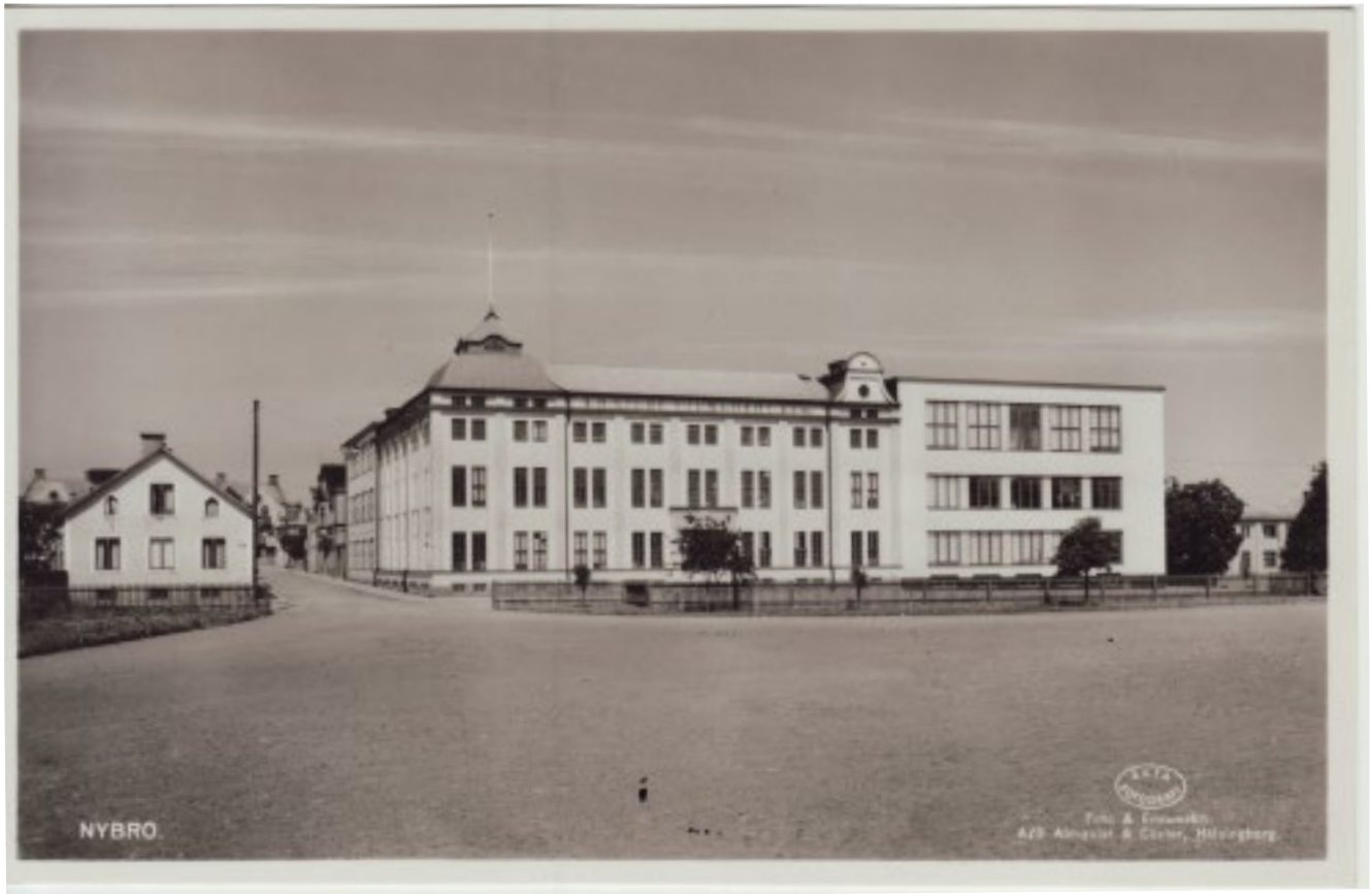
Ljungdahls kuvertfabrik. Den vänstra delen är byggd 1926 och den högra 1936.