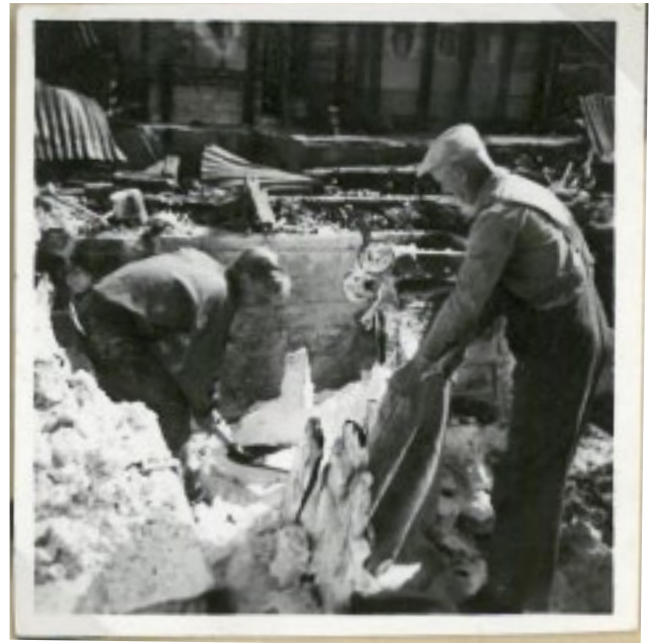
Efter branden i Nybro glasbruks gamla hytta 1946.

När så kriget var över på våren 1945 stod Sverige inför en stigande konsumtion. Oljan blev åter tillgänglig och AB Kemisk Tekniska Glasfabriken startades upp på nytt i Nybro.