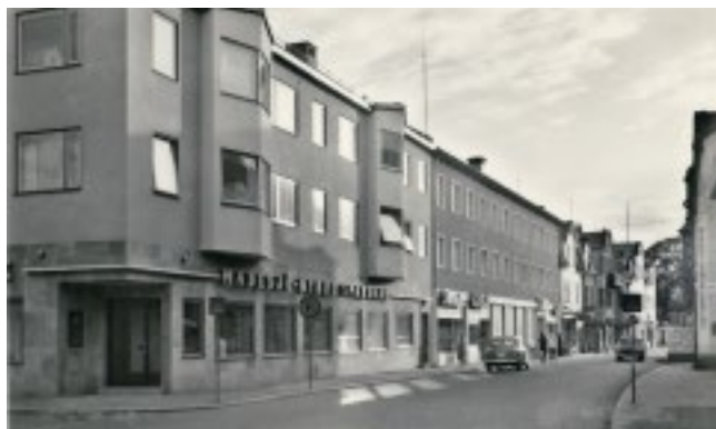
Storgatan i Nybro på 1960-talet.