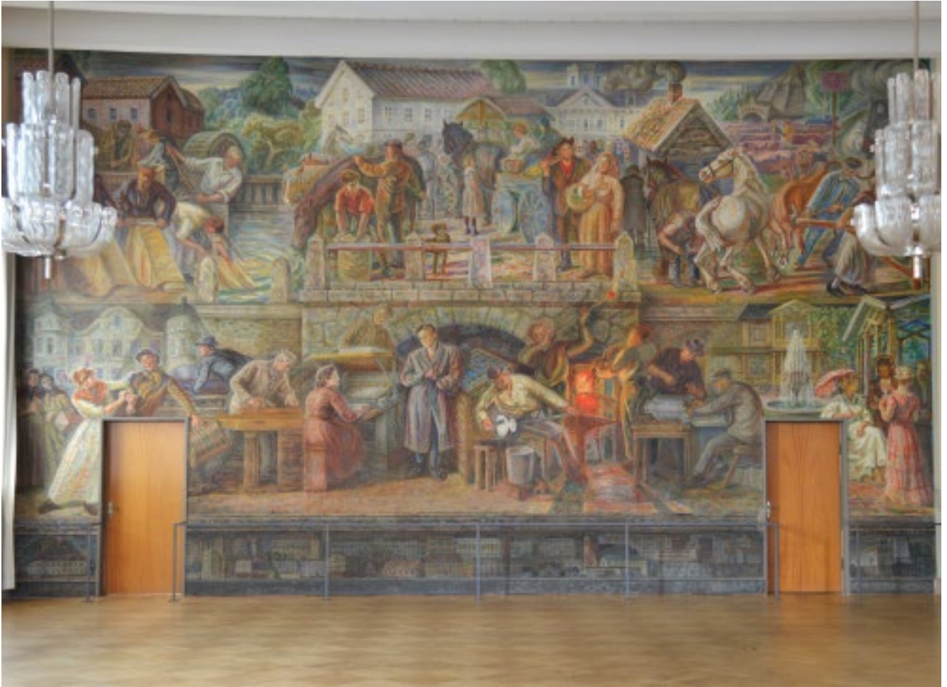
Gunnar Theanders stora fresk i stadshuset.

täcker en yta av 66 kvm och skapades av nybrosonen Gunnar Theander och invigdes 1969. I taket hängde ljuskronor från Orrefors Glasbruk och dörrarna med intarsia är tillverkade av ortens stora träföretag Kährs. Hotellet är i övrigt kulturhisto-