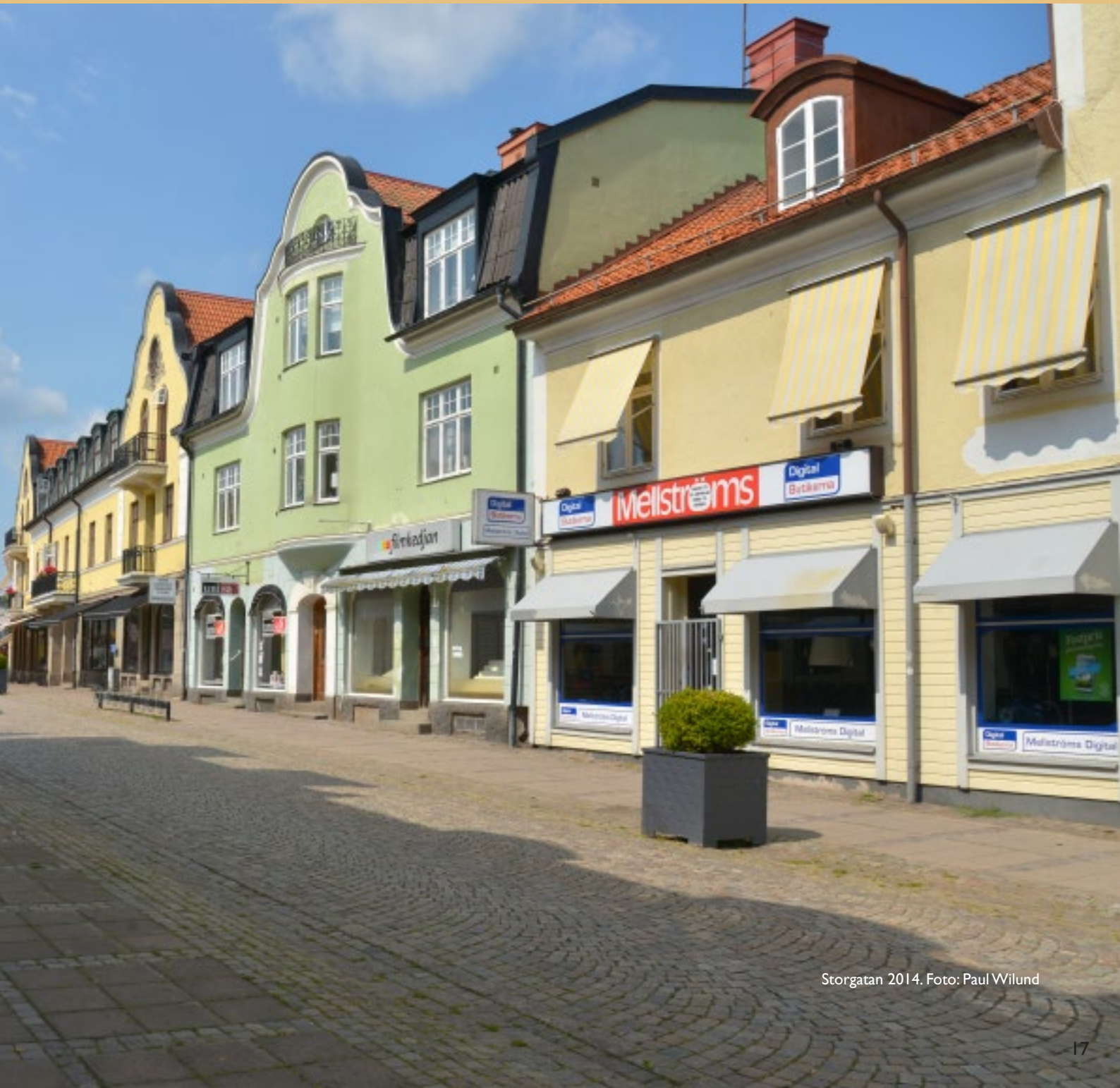
Storgatan 2014.