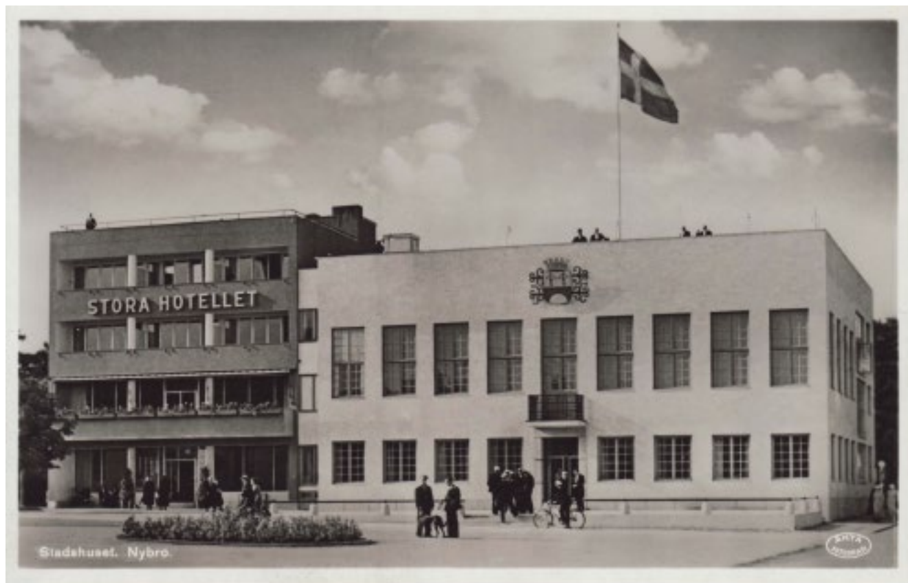
Stadshuset och stora hotellet, uppfört 1935. Bilden är tagen innan det stora taket tillkom 1946.