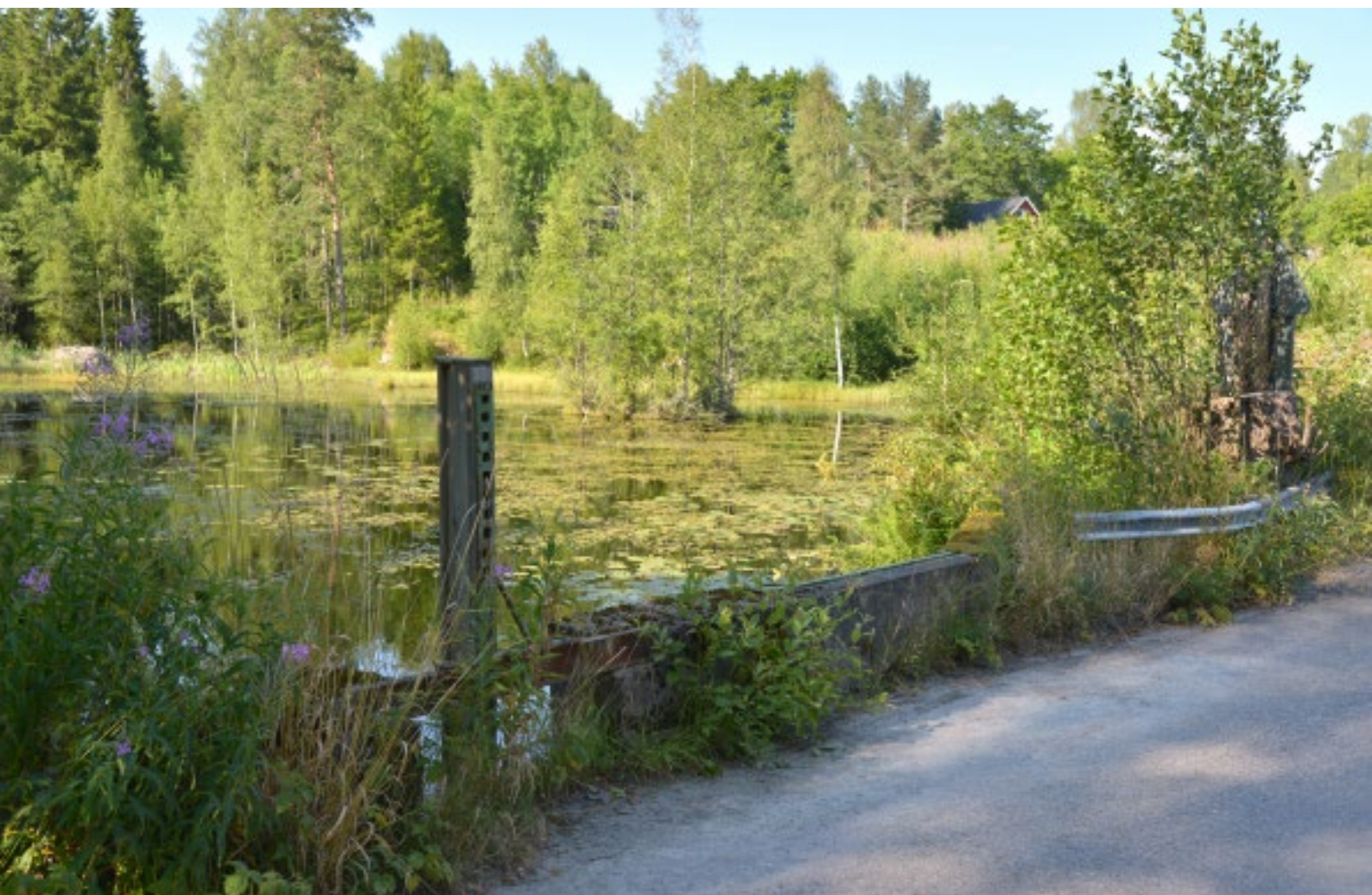
Dammen precis ovanför spiksmedjan. Vattnet härifrån var kraftkällan för framförallt Lindshammars tidiga industrier.