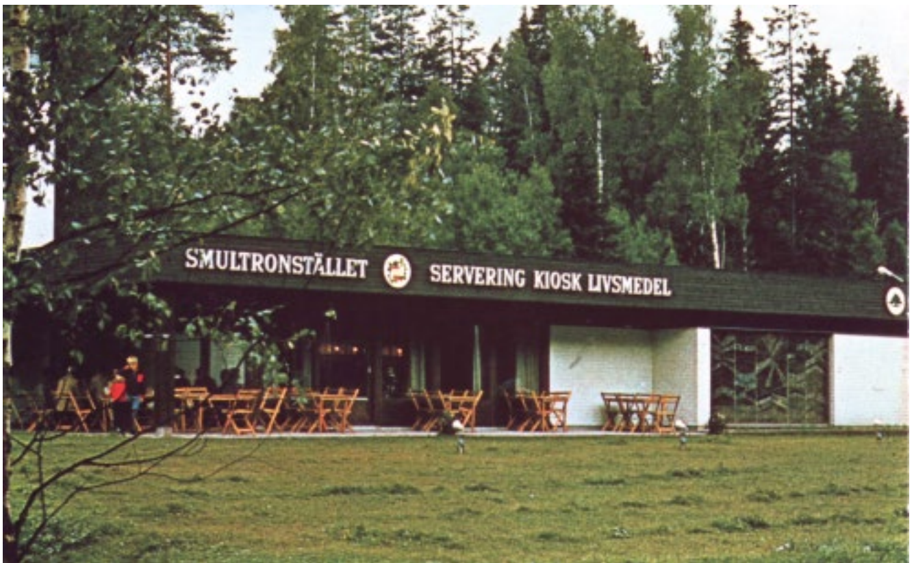
Smultronstället på 1980-talet.