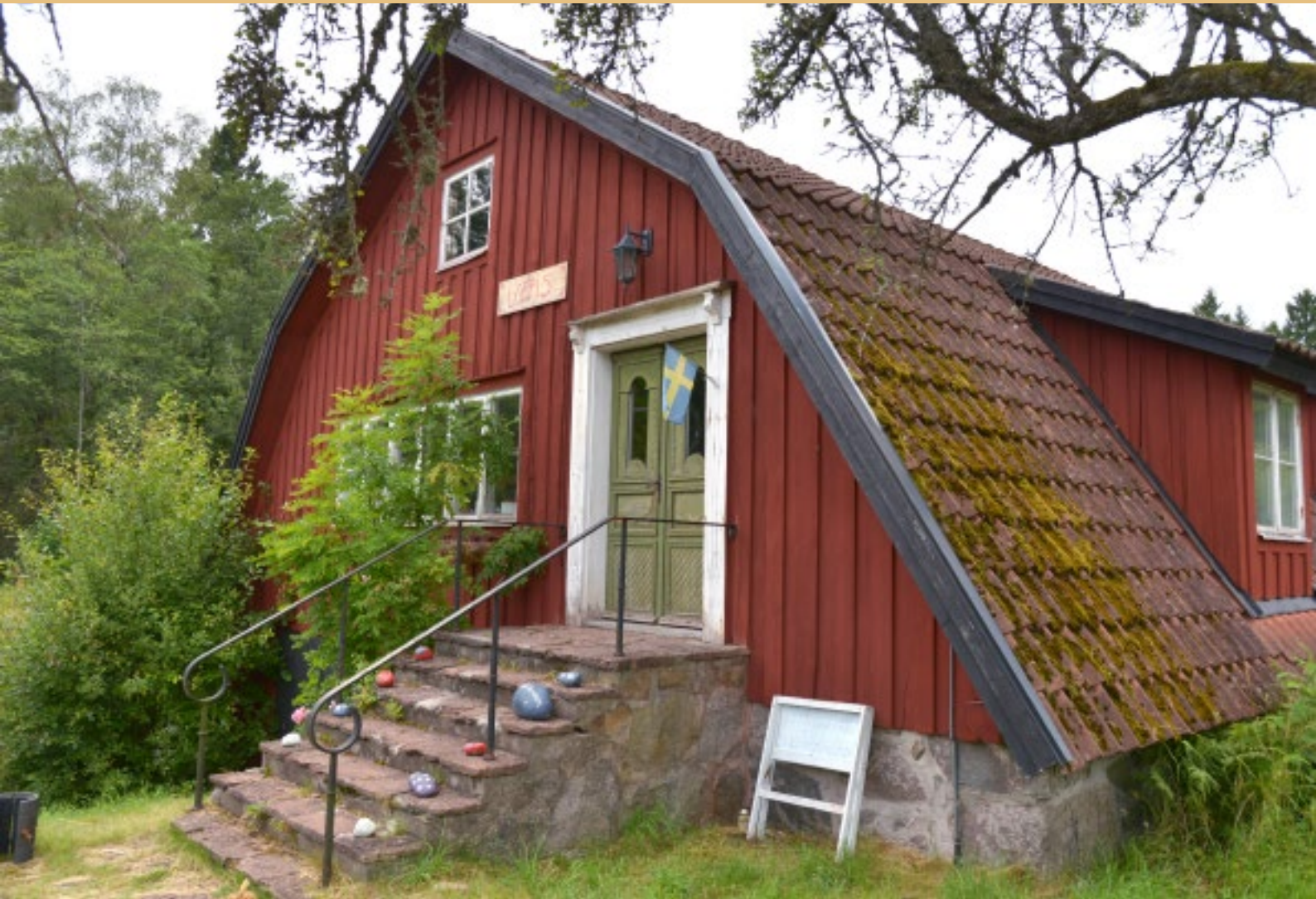
Spiksmedjan, uppförd 1866. Byggnaden användes som Folkets Hus under 1920-talet.