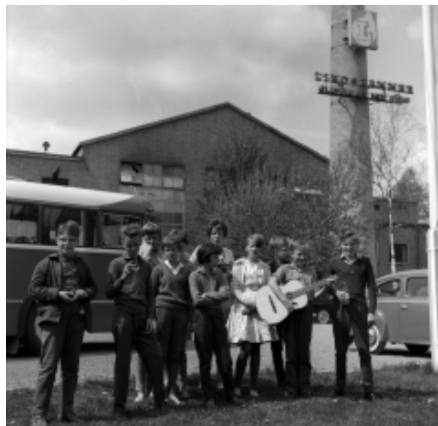
Klass 6A från Österängsskolan i Jönköping på skolresa 1961. Lindshammar var ett av stoppen.

Under början av 1970-talet kom hela glasbruksnäringen i Småland att drabbas av kris. Konkurrensen var stor emellan dem då de flesta vid tiden producerade prydnadsglas och inte exempelvis emballageglas som honungs- och konservburkar, vilket många bruk livnärt sig på under tidigare decennier. Dessutom började det importeras billigt maskintillverkat slipat glas från utlandet.