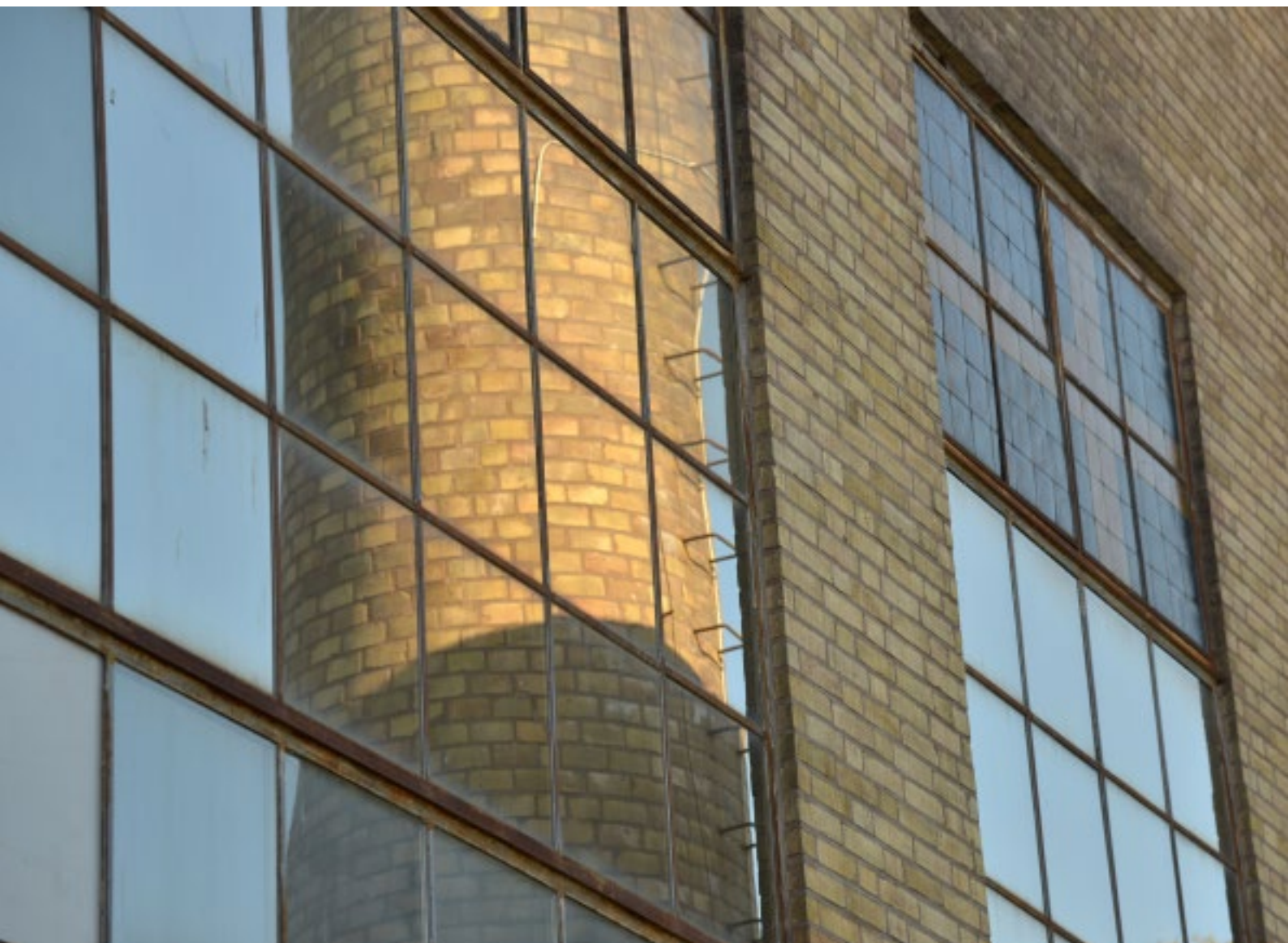
Fabriken fick stora fönster för att kunna släppa in maximalt med ljus.