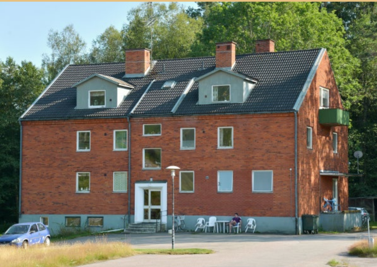
Dackegården uppfördes 1955, och innehöll bostäder, butik och matservering.