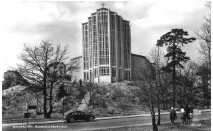
Uppenbarelsekyrkan i Hägersten, byggd 1961 med arkitekturglas från Lindshammar.