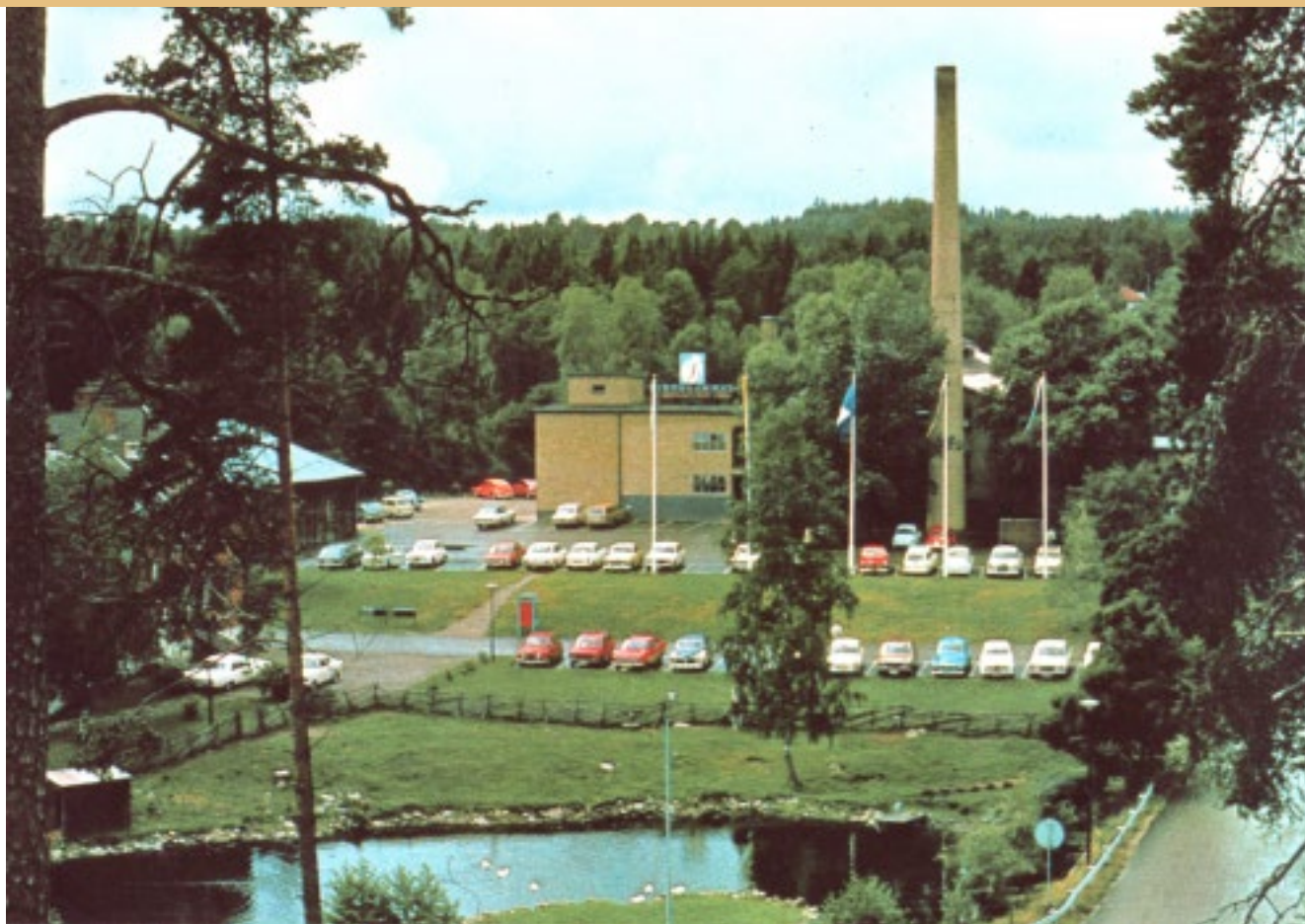
Glasbruket under 1960-talet.