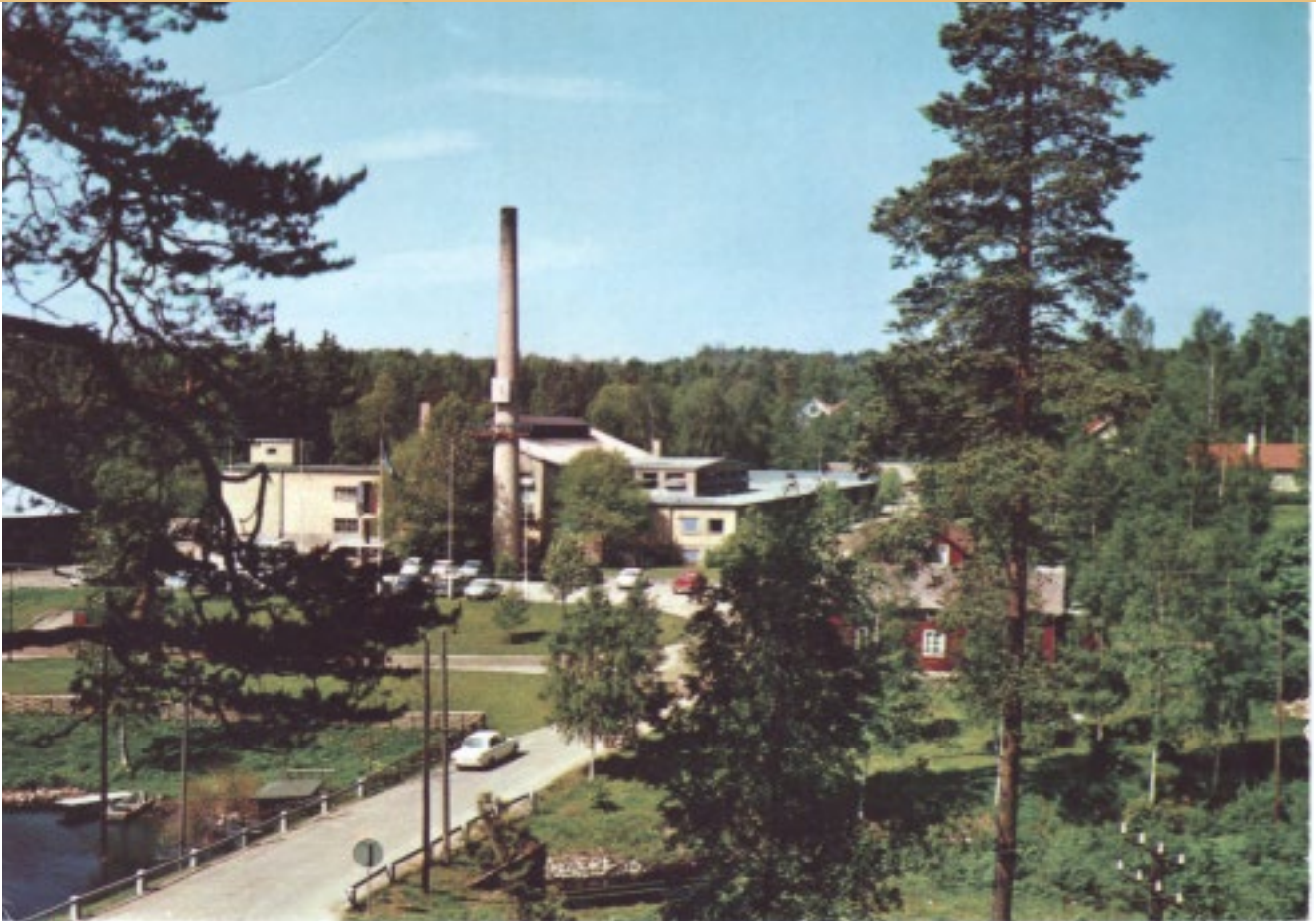
Glasbruket under 1970-talet.