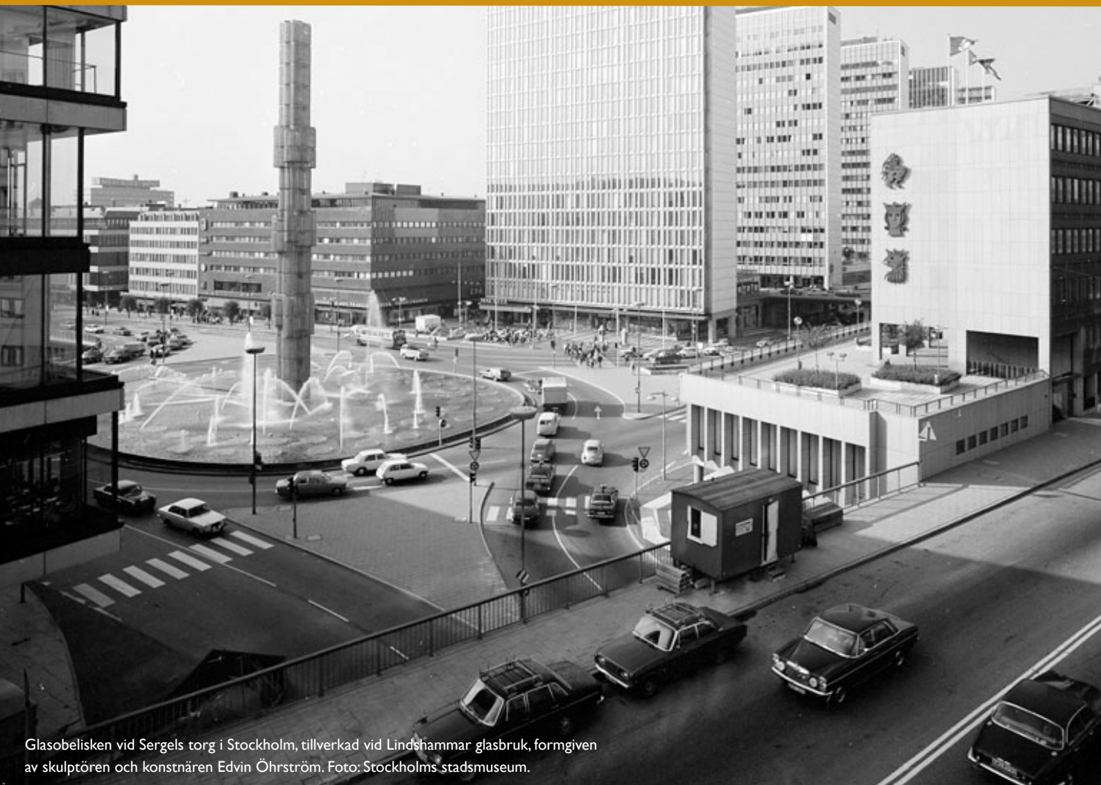
Glasobelisken vid Sergels torg i Stockholm, tillverkad vid Lindshammar glasbruk, formgiven av skulptören och konstnären Edvin Öhrström.