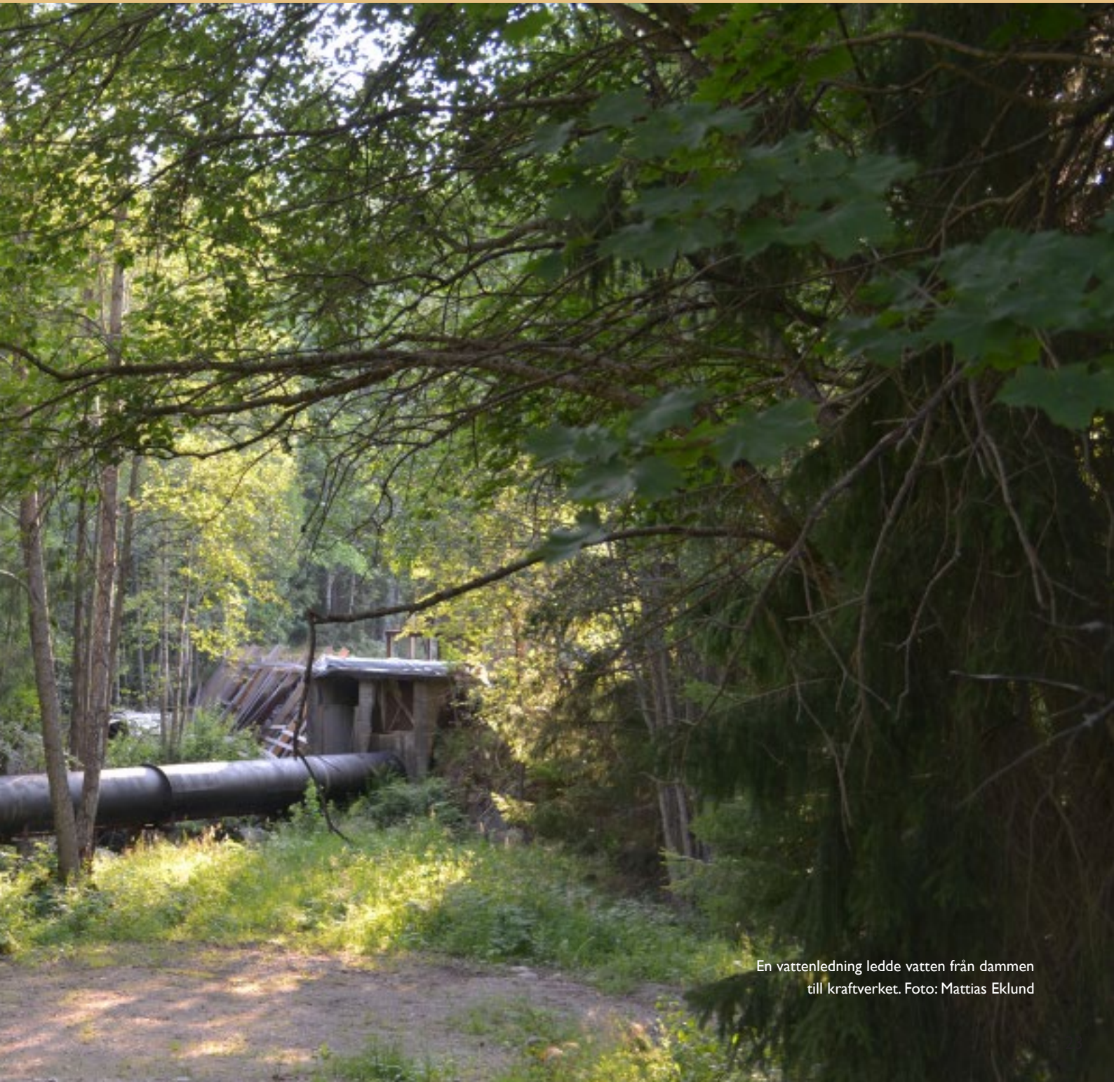
En vattenledning ledde vatten från dammen till kraftverket.