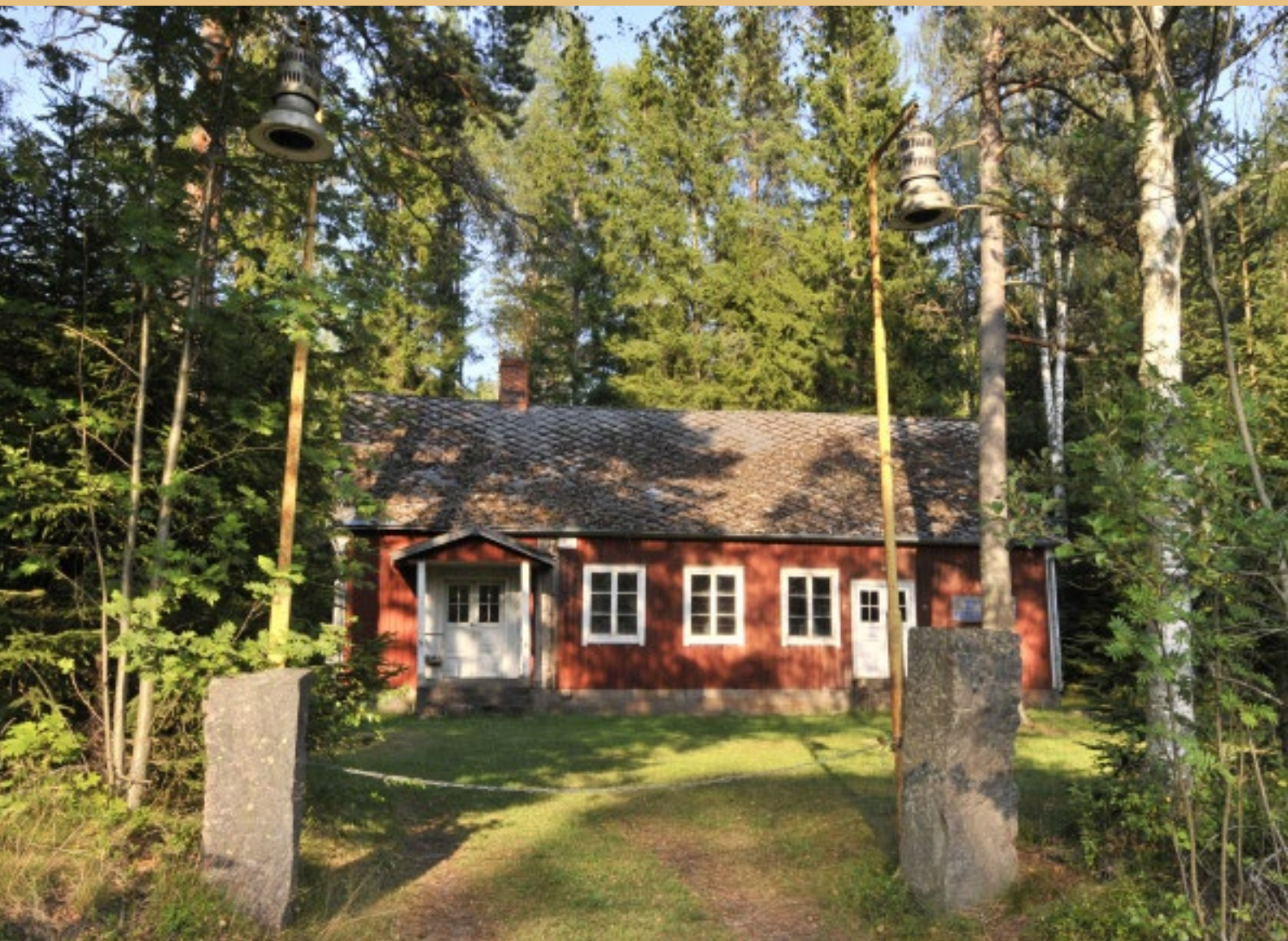
Gamla Folkets Hus, uppfört under början av 1930-talet. Vid ingången står två gaslampor.