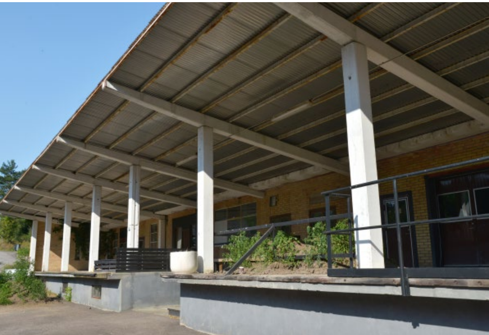
På fabriken baksida lastades glasbrukets varor via lastkajen som väderskyddades under ett elegant tak med tunna betongkonsoler. I gavelväggen i bakgrunden sitter gjutna glasprismor från bruket.