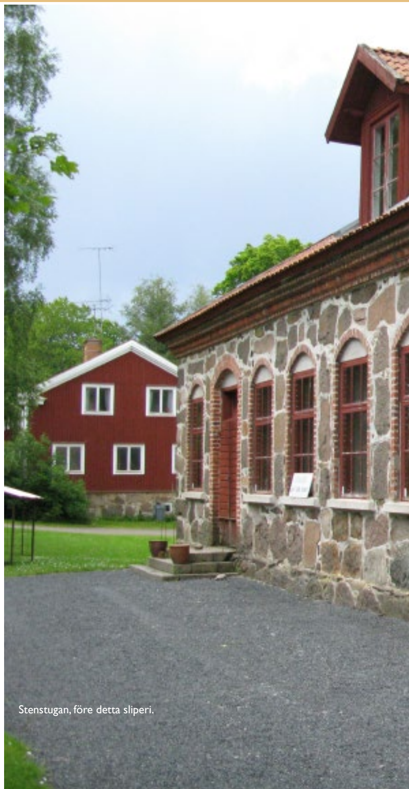
Stenstugan, före detta sliperi.

Eftersom efterfrågan på glas ökade i slutet av 1800-talet, lät Kosta glasbruk 1897 bygga en liten hytta i Johanstorp, en bit norr om Kosta. Bruket hade haft en hytta här tidigare som hade lagts ner. Nu återuppstod den igen. All tillverkning av flaskor och billigt glas förlades hit, medan det ”finare” glaset var förbehållet Kosta. Men just slipat glas var mycket efterfrågat. Trots att man i Kosta hade 20 slipstolar i det nya sliperiet i Stenstugan, hade man svårt att mätta marknaden. Därför anlades med tiden också ett sliperi i Johanstorp. Sliperiet i Johanstorp levde vidare ända till 1932, även sedan hyttan där stängts 1910. Johanstorp ligger norr om Kosta och väg 31, mellan sjöarna Lången och Möckeln.