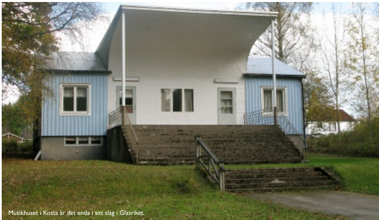
Musikhuset i Kosta är det enda i sitt slag i Glasriket.

upp och man hjälptes åt att bygga musikhuset. Det var klart och kunde invigas 1948. Sedan dess har det varit till stor nytta och betydelse i Kosta. Än idag har musikkåren huset som sin samlingslokal och varje valborgsmässoafton håller man konsert från trappan.