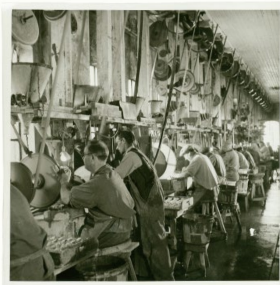
Slipning av glas pågår i gamla sliperiet. Kraften kom från en mycket stor ångmaskin och överfördes via remmar till varje sliperimaskin.

Här ligger brukets sliperi. Det uppfördes efter en brand 1901. För att få kraft till anläggningen fanns en mycket stor ångmaskin och ångpanna. Vid ångmaskinen fanns ett ca 2 meter stort drivhjul, som drev en huvudrem, som var 50 cm bred och 75 meter lång! I varje sliperilokal gick liggande ledningar i taket och från dem remmar ner till varje enskild slipskiva. För att driva planskivorna fanns lodräta axlar som vilade på en punkt där en femöring lades som skydd mot slitaget nedåt. När sliperiets verksamhet var som mest omfattande fanns här plats för 250 slipare. Ångpannan eldades med torv. Transmissionssystemet är idag borta och ångmaskinen såldes till en snickerifabrik i Lenhovda. Byggnaden används än idag som sliperi, men också till andra verksamheter såsom till exempel syning av glas.