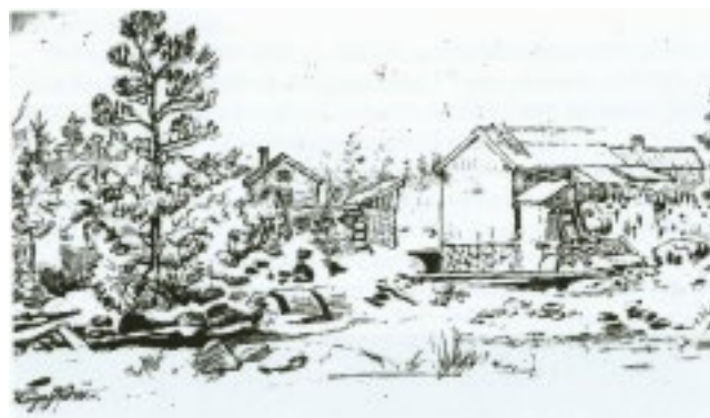
Kvarnmiljön Högaström vid Lyckebyån. Även glasbruken i Transjö, Åfors och Johansfors hämtade kraft från Lyckebyån. Teckning av Kilian Zol, 1848.

Sedan en ny anläggning anlagts på 1840-talet väster om Kosta, vid Catrinefors eller Krossen som platsen också kallades, flyttades en del av krossningen dit. Vid Högaström installerades år 1920 en elektrisk kraftstation i anslutning till kvarnbyggnaden. Denna levererade ström till glasbruket i 30 år, och blev den sista kraft som togs här vid Högaström. Då hade platsen varit glasbrukets kraftkälla i mer än 200 år. Idag återstår ett par byggnader, dammar och ett litet vattenfall. Det krävs fantasi för att se storheten i denna plats, som en gång var avgörande för uppbyggnaden och utvecklingen av Kosta glasbruk. Husen här är idag privata, så gör ditt besök med respekt.