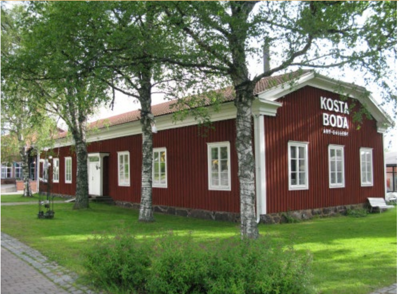
Det gamla brukskontoret som idag är integrerad med utställningshallen.