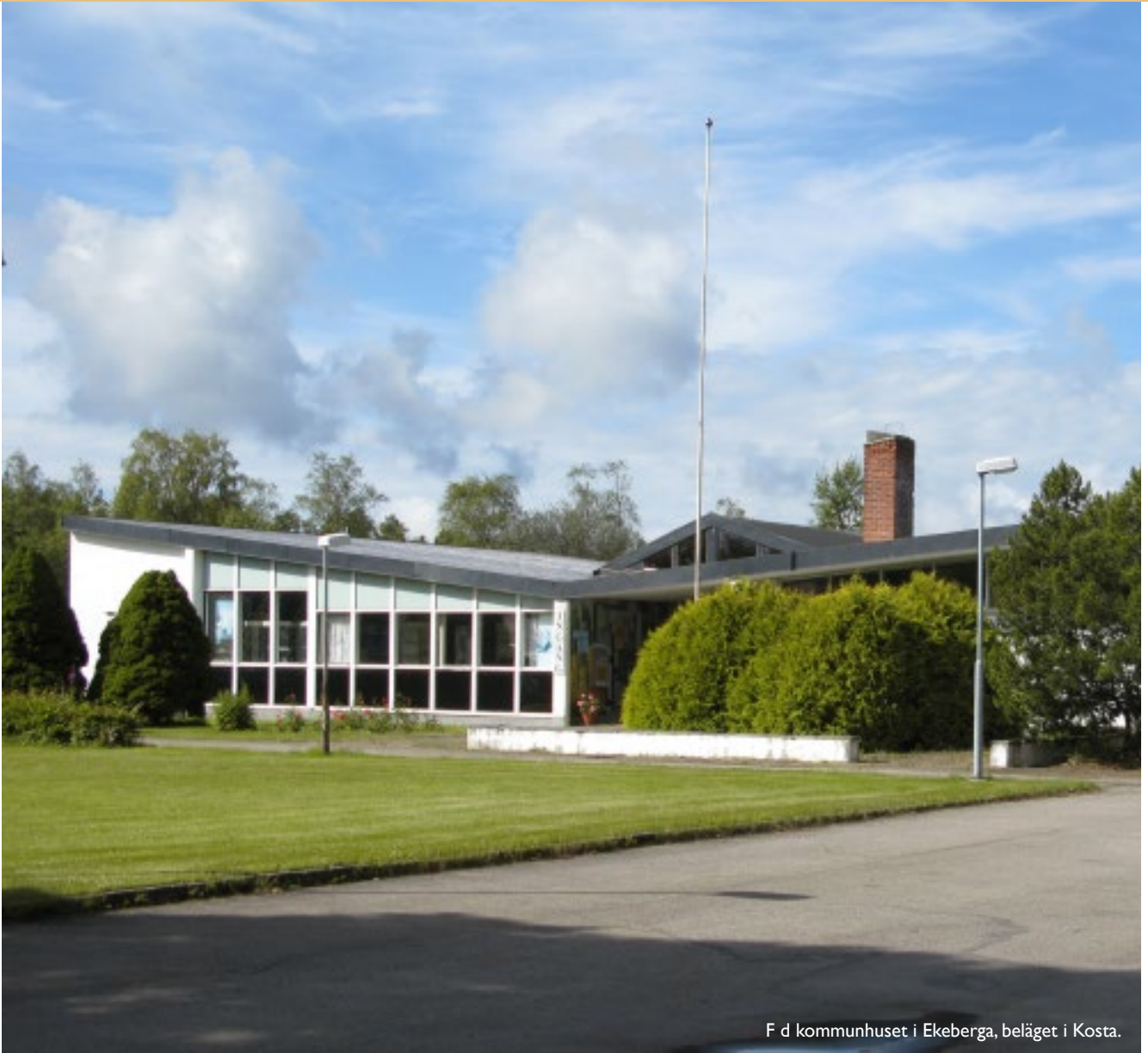
F d kommunhuset i Ekeberga, beläget i Kosta.

Söder om Folkets hus, en bit in från Stora vägen, ligger Kosta kommunhus. Den vita byggnaden med sitt tak som sluttar in mot byggnadens centrum ritades av arkitekten Börje Wecke 1960. En av väggarna vid entrén pryds av en glasmosaik som