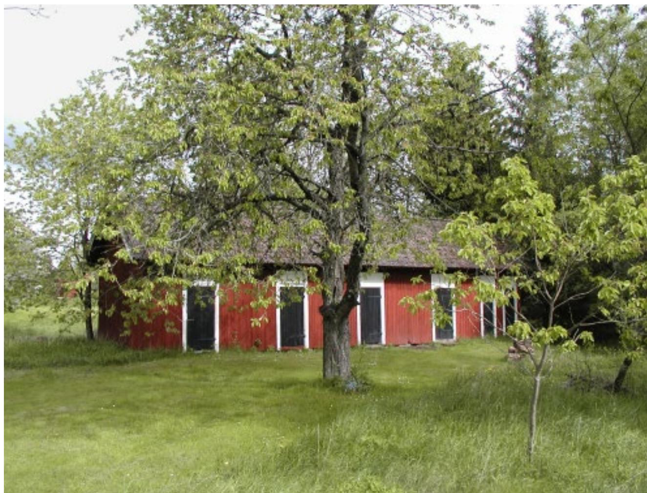
Uthus till de gamla arbetarbostäderna.