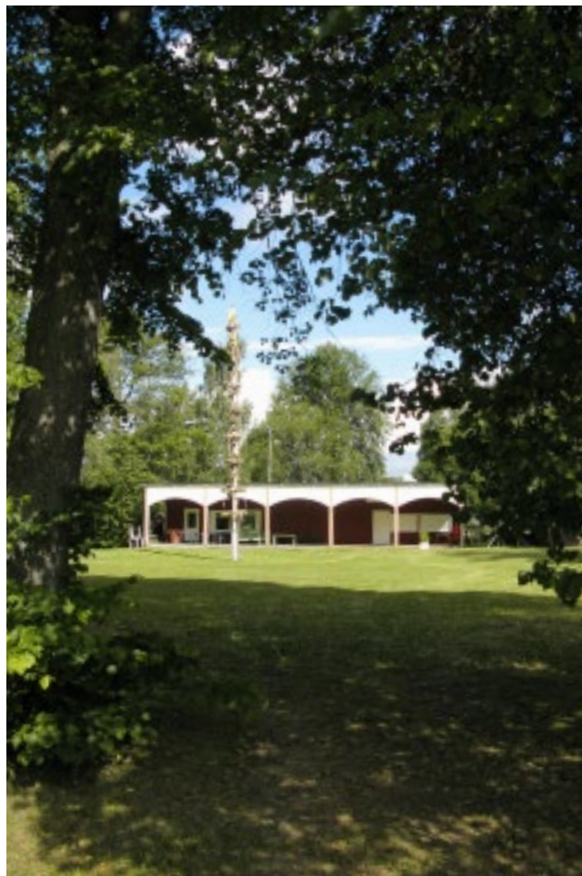
Folkets park i Kosta.

Mellan Ekeberga kyrka och Kosta glasbruk ligger centrum i samhället Kosta. Här finns livsmedelsaffär, Folkets hus och det före detta kommunhuset i Ekeberga. Folkets park och Folkets hus hade sin grund i en förening som bildades 1909. Det dröjde dock till 1920 innan man bestämde sig för att hyra en tomt och började bygga Folkets park. Fyra år senare började man bygga ortens första Folkets hus. Det stod klart 1925. Verksamheten med danser, teater, operetter, föreläsningar och möte blev mycket populär. Men 1936, i samband med utbyggnaden av danshallen, brann huset ner. Snabbt byggdes ett nytt Folkets hus efter ritningar av Sture Ekström. Det är den byggnad som idag är Folkets hus. Sitt nuvarande utseende fick huset i samband med en renovering 1975.