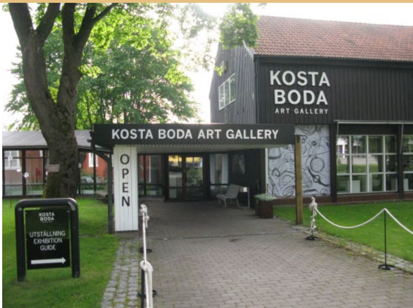
Entrén till utställningshallen.