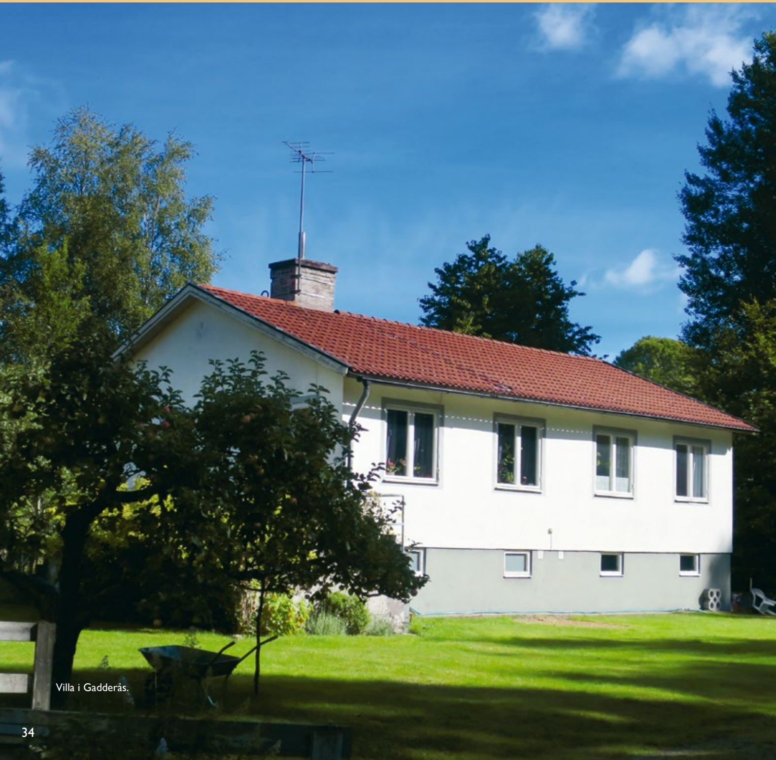
Villa i Gadderås.