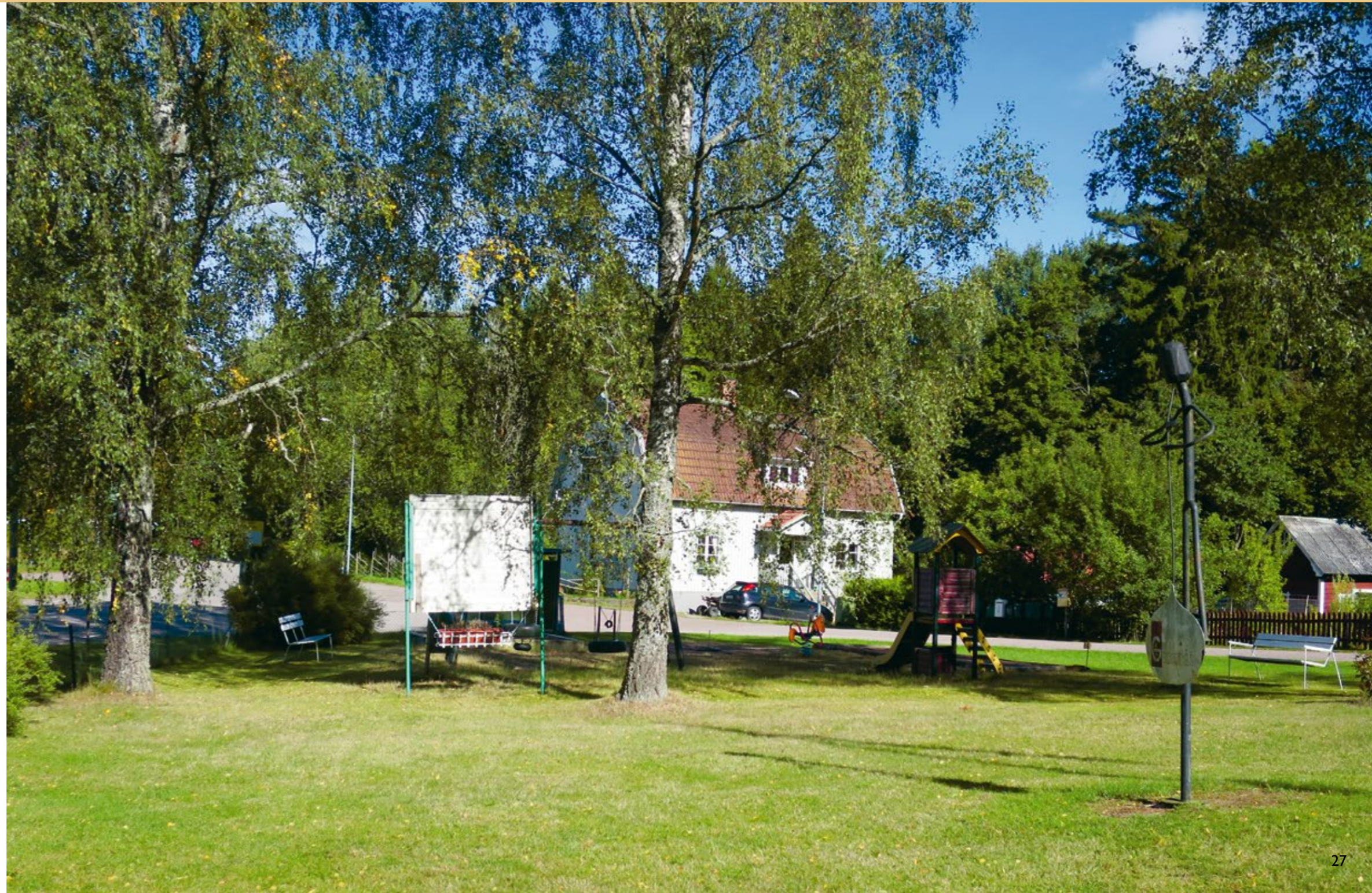
Samlingsplatsen i Gadderås.

Mitt i Gadderås finns ortens samlingsplats med anslagstavla och busshållplats. Här finns också en lekplats och en gräsmatta med en glasblåsare av metall som hälsar välkommen till orten. Här har samhällsföreningen varje sommar midsommarfest. Samhällsföreningen bildades 1968 efter brukets nedläggning. Målet var att hålla liv i orten och arbeta för ortsbarnas bästa. Man har bland annat ordnat med oljegrus och gatubelysning i samhället, samt arbetat för att få fiberkabel till orten.