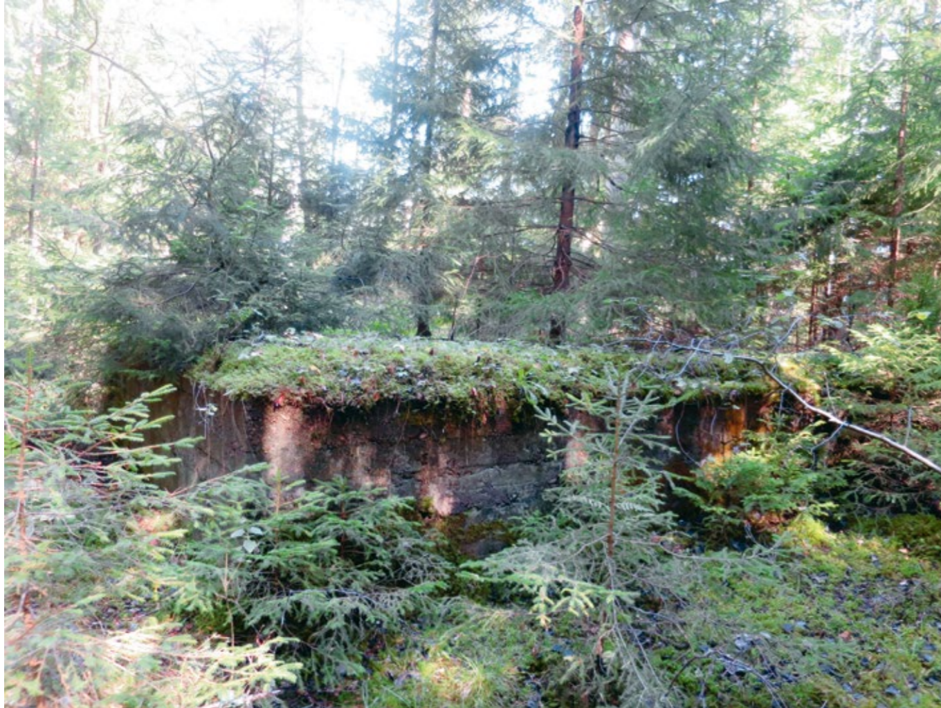
Grunden efter bastun i Gadderås.