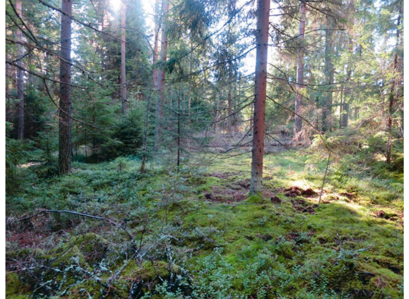
Gadderås första fotbollsplan.

Sydost om bastun fanns under 1930- och 1940-talen en dansbana. Spåren av den är idag helt borta.