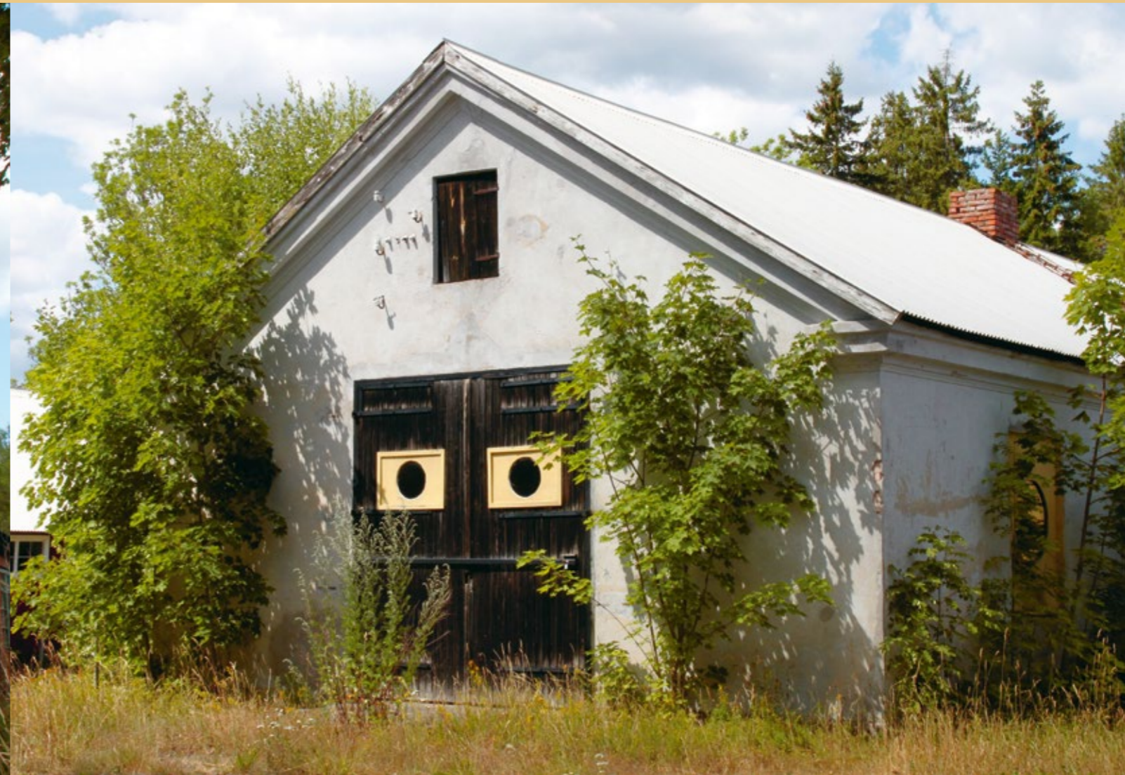
Det vitputsade sliperiet.

Många glasbruksmiljöer består av flera byggnader med olika funktioner. I Gadderås har antalet byggnader varit få. Flera av funktionerna på bruket har varit samlade i hyttbyggnaden, till exempel sprängkammare, där kappan på servisglaset togs bort, och mængkammare, där ingredienserna till glasmassan blandades.