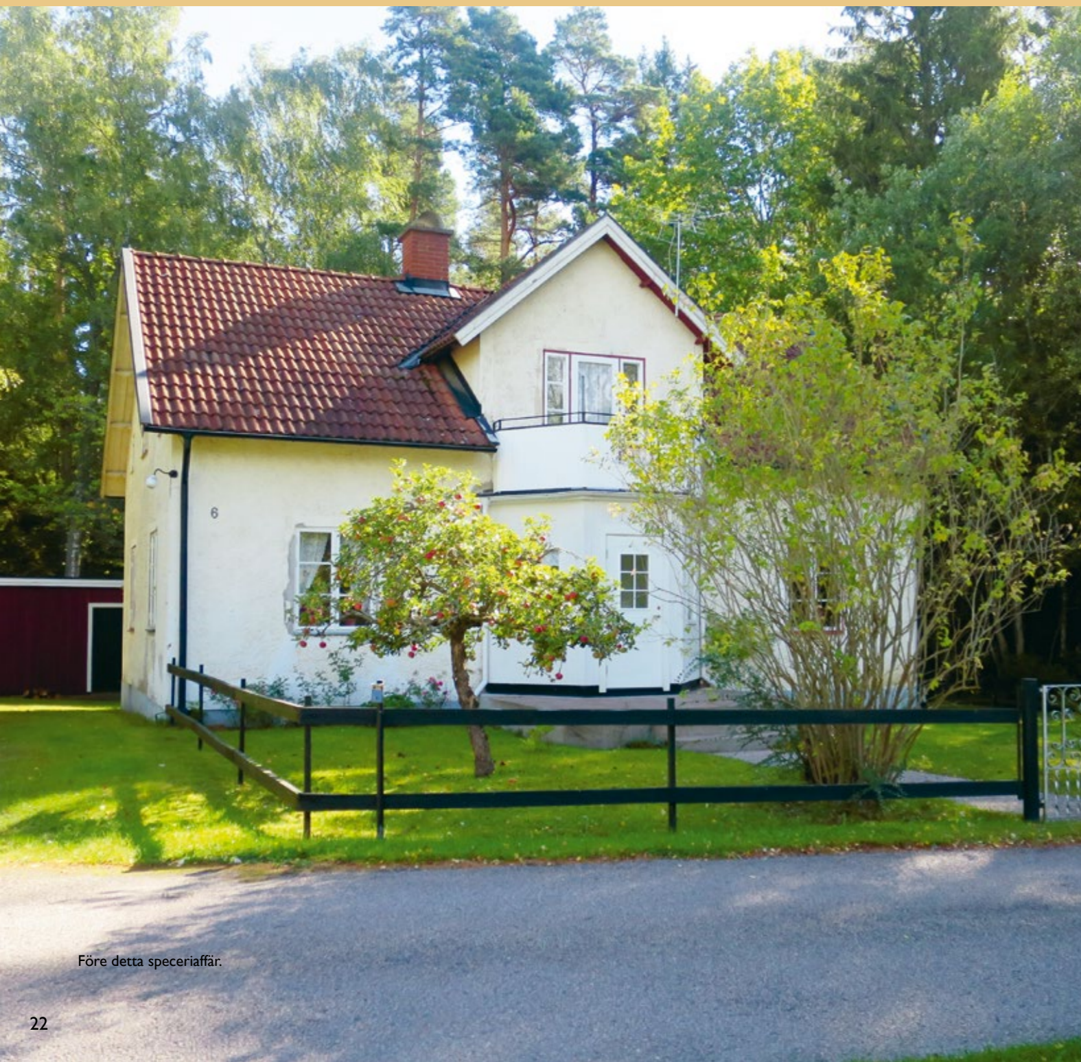
Före detta speceriaffär.