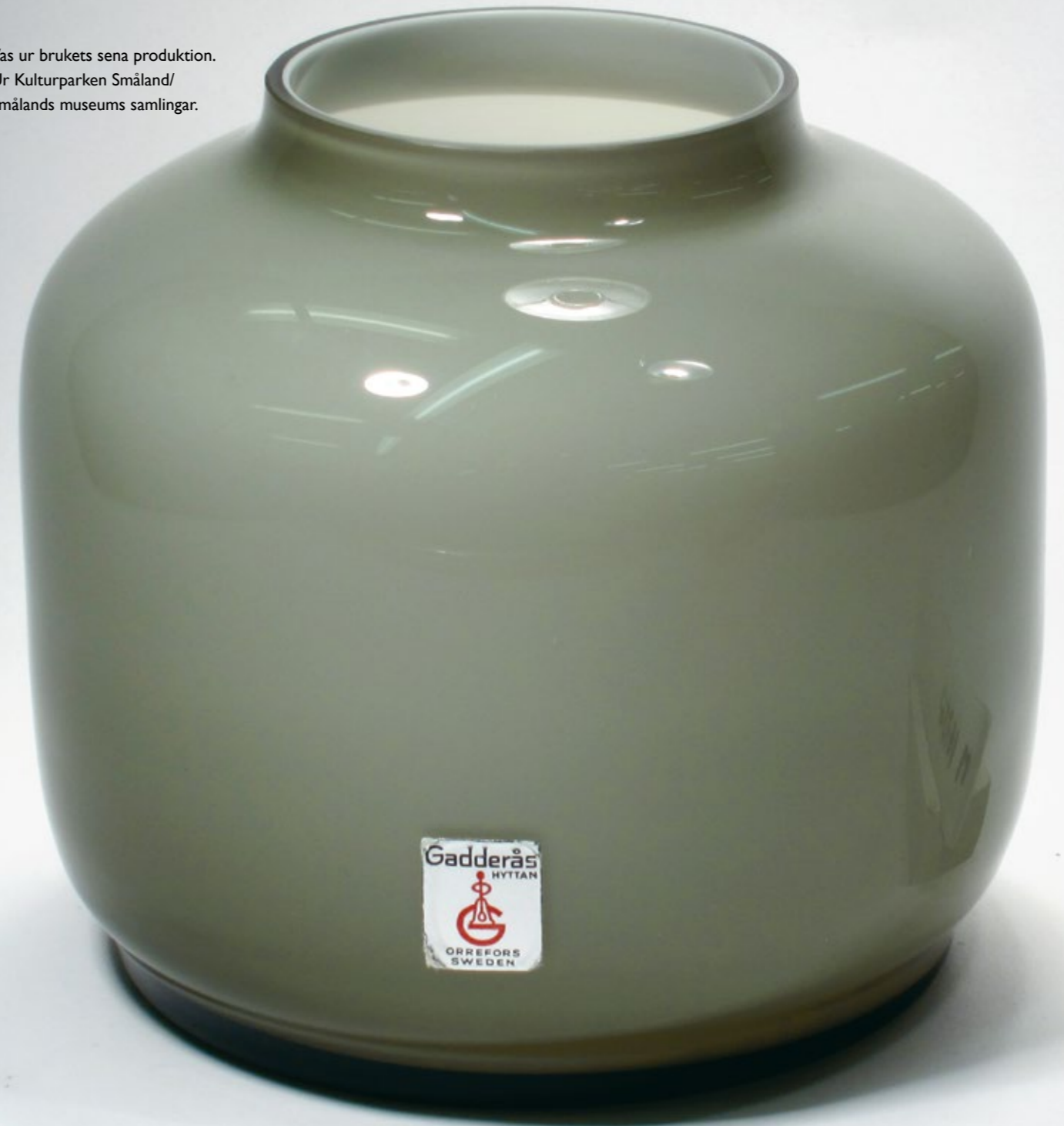
Vas ur brukets sena produktion.

och belysnings- och konstglas blev viktiga produkter. Bara glödlampskolvar med speciell utformning fanns kvar från den tidigare produktionen. Olle Högströms tid i Gadderås blev kort. Bruket såldes 1960 till AB Flygsfors glasbruk under ledning av Roland Holmdahl. Den positiva satsningen fortsatte under några år. Nytt folk anställdes. Bland annat rekryterade man glasarbetare från Grekland och Tyskland. 1965 bildades Flygsforsgruppen med bruken i Flygsfors, Gadderås och Målerås. Men den positiva utvecklingen avbröts av den djupa kris som hela den svenska glasbranschen upplevde i slutet av 1960-talet och in på 1970-talet. Gadderås glasbruk lades ner 29 april 1967. 50 personer blev arbetslösa. Flera anställdes i Flygsfors, andra i Orrefors, men många lämnade också glasindustrin och sökte sig till andra branscher.