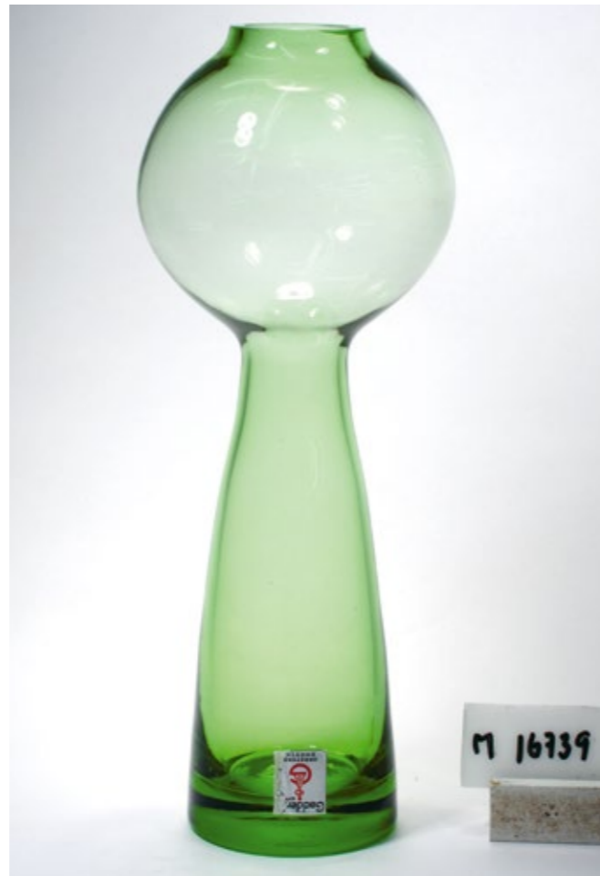
Glas från Gadderås glasbruk. Ur Kulturparken Småland/Smålands museums samlingar.

Gadderås var ursprungligen ett buteljbruk men från 1885 övergick man till att tillverka fönsterglas. På 1930-talet konkurrerades det munblåsta fönsterglas ut av ny teknik där glasmassan drogs genom valsar. På så sätt kunde man få större rutor. Många fönsterglasbruk lades ner eller lade om produktionen. I Gadderås övergav man fönsterglastillverkningen 1928. Istället började man 1932 att blåsa glödlampskolvar. Med tiden hårdnade konkurrensen även när det gäller glödlampor. I slutet av 1950-talet ställdes produktionen om igen. En liten produktion av speciella glödlampskolvar levde kvar men bruket kom främst att inrikta sig på belysnings- och konstglas.