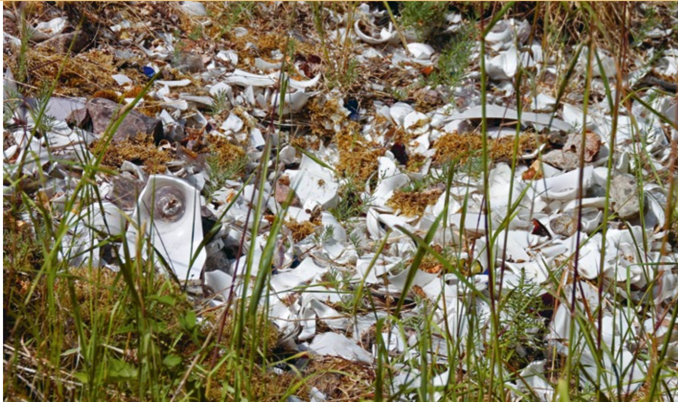
Bakom hyttan ligger glastippen med fragment av brukets produktion. Tippen är en källa till brukets historia, men också till förorening av miljön.

De osäkra arbetsförhållandena och perioderna med produktionsstopp gjorde att folket på orten blev rörligt. Många passerade genom det lilla samhälle som växte fram. År 1928 slutade man producera fönsterglas och bruket lades ner. Under fyra år låg tillverkningen nere vid Gadderås glasbruk men 1932 startades den på nytt av Sigurd Ekenfors. Nu var produktionen inriktad på tillverkning av glödlampskolvar. Satsningen lyckades och bruket blev mycket framgångsrikt under 1930- och 1940-talen. År 1946 såldes hälften av bolagets aktier till Flygsfors glasbruk och man ombildades till AB Gadderås Glasbruk. Vid den här tiden producerades 6,5 miljoner glödlampskolvar per år och 50 personer var anställda.