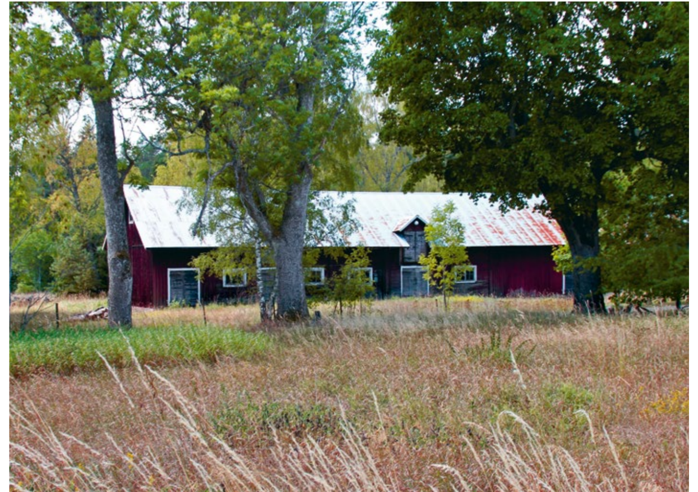
Ladugården som hörde till glasbrukets jordbruk.