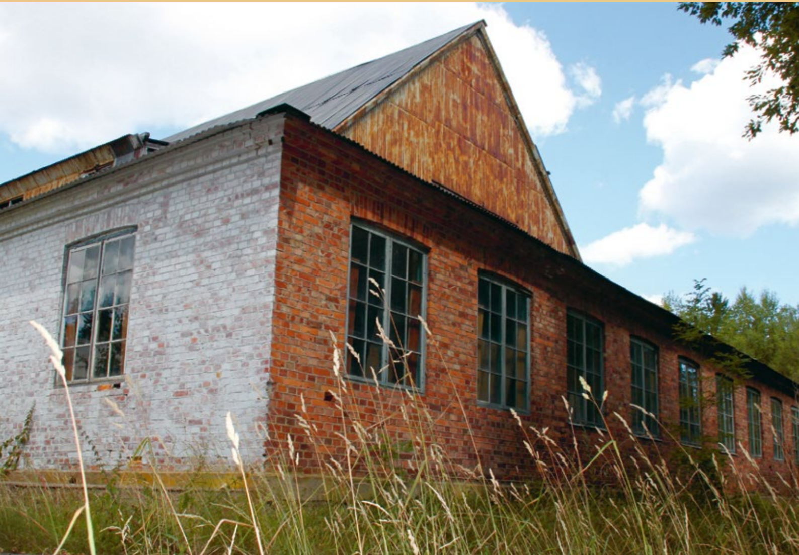
Gadderås glasbruks hytta.