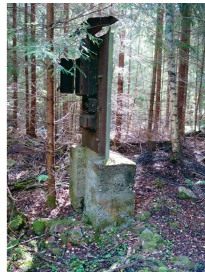
På platsen där sågverket tidigare låg finns idag rester av grunder, järnvägsräls och skrot. Här är lämningarna av sågens transformatorstation.