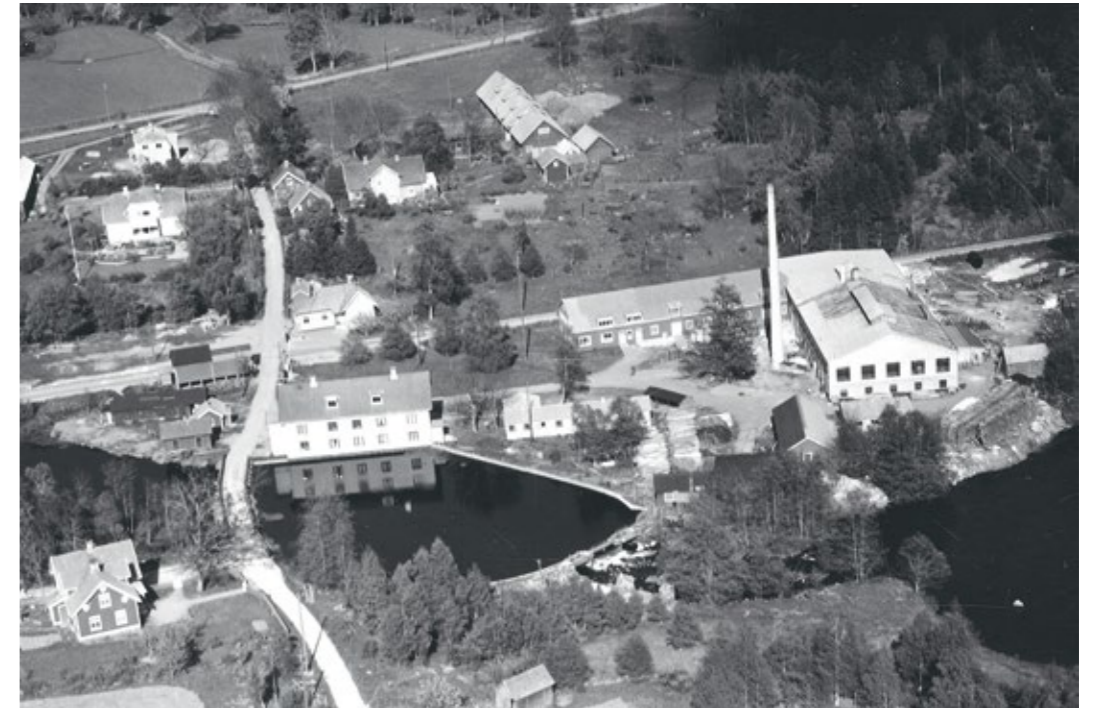
Björkshults glasbruk 1950.

Efter första världskriget köptes Björklunda Glasbruk av grosshandlaren Emil Karlsson. Han bytte namn på bruket till Björkshults Glasbruk. Den nye ägaren innebar en tid av stabilisering för det hårt prövade bruket. Men 1930-talet innebar en ny period av prövningar. 1933 hade en ny grupp av ägare med