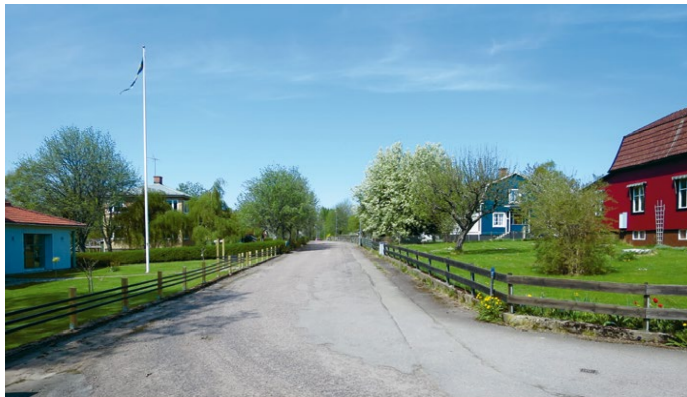
Vyer över villaområdet norr om glasbruket.