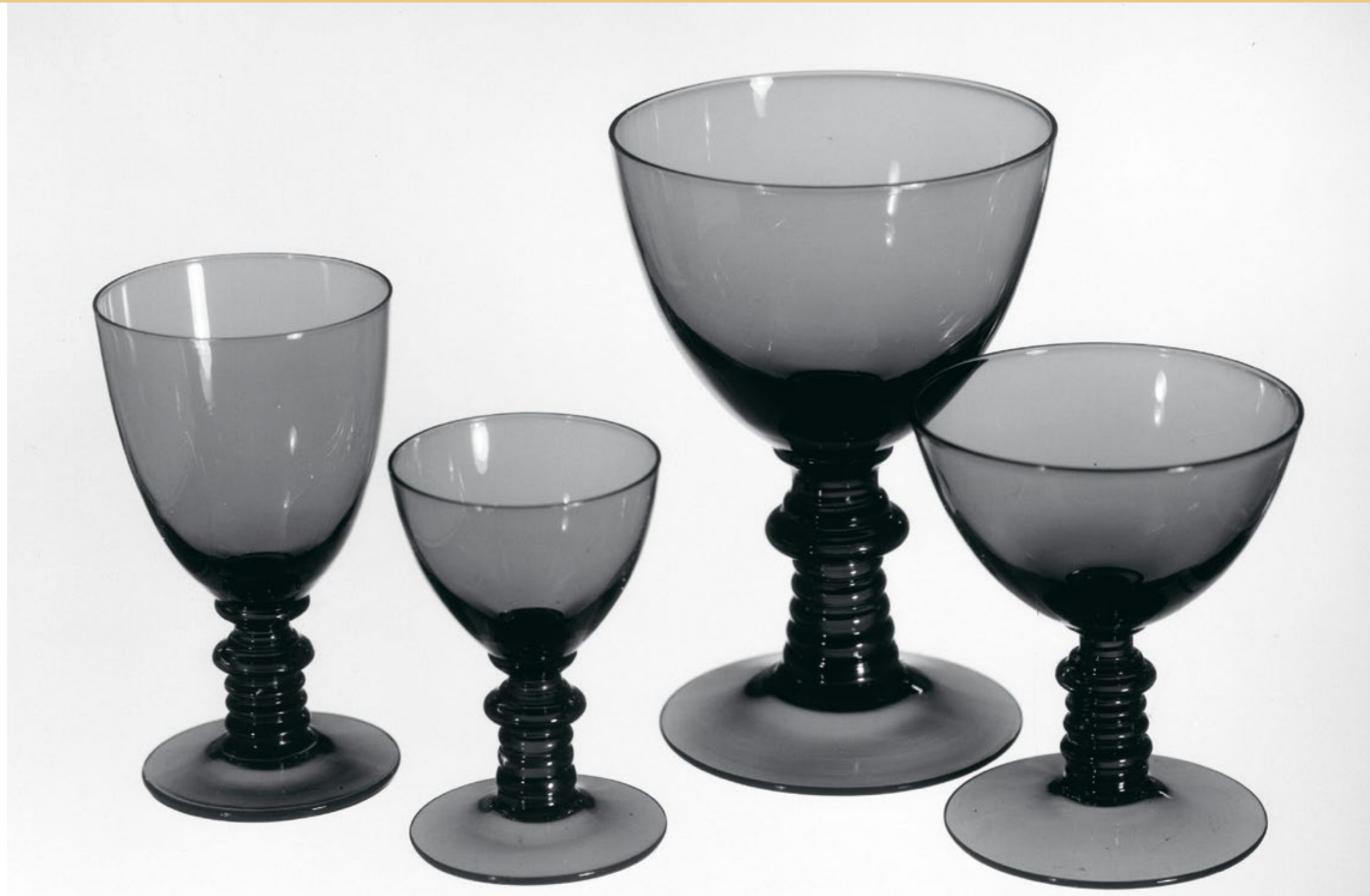
Servisglas från Björkshult. Ur Kalmar läns museums samlingar.

På 1950- och 1960-talen när bruket hade sin storhetstid exporterade man sitt glas till 35 olika länder runt om i världen. På 1970-talet blev man kända för sitt ”antikblå” glas som ofta såldes i konstnär- och hantverksbutiker.