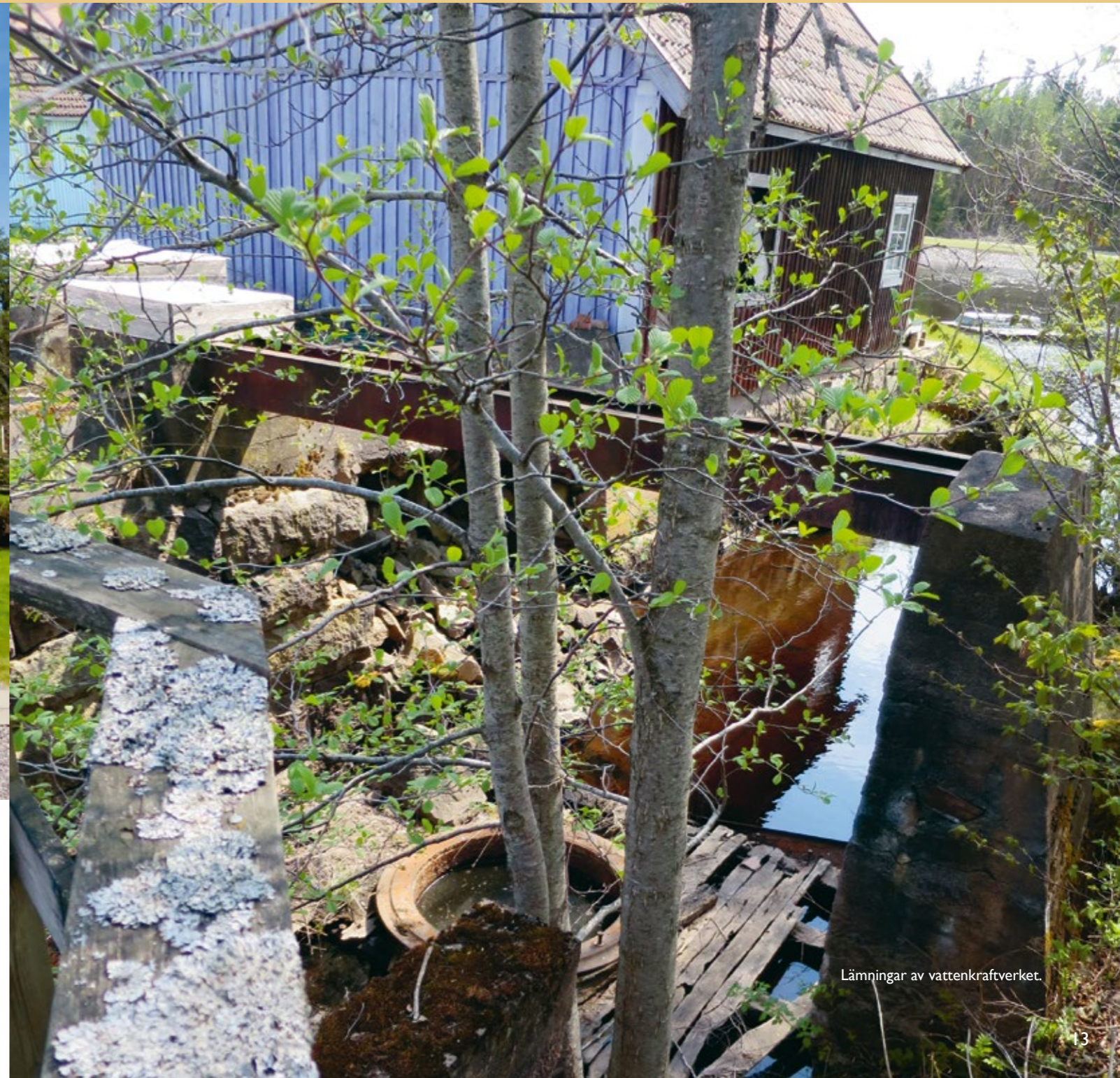
Lämningar av vattenkraftverket.

Idag återstår bara ruinen efter brukets vattenkraftverk. Det byggdes omkring 1925 och ledde till att man kunde elektrifiera bruket. Det var viktigt inte minst för slipstolarna i sliperiet som annars drevs med direktverkande vattenkraft. Anläggningen revs 1961.