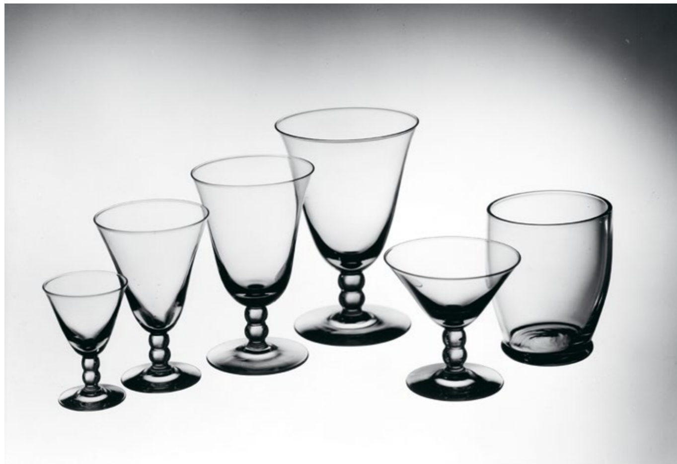
Servisen Örn.