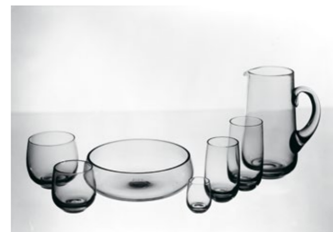
Glas från Björkshults glasbruk. Ur Kalmar läns museums samlingar.