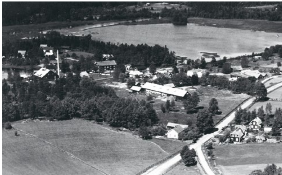
Björkshults glasbruk 1935.