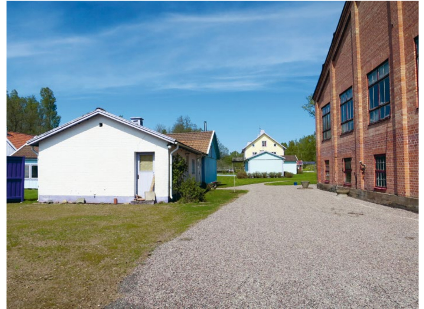
Sanitetsbyggnaden till vänster.

överföring via remdrift. När kraftverket byggdes elektrifierades verksamheten och sliperiet kunde flyttas upp i hyttbyggnaden. Byggnaden har sedan använts i kursverksamheten på området.