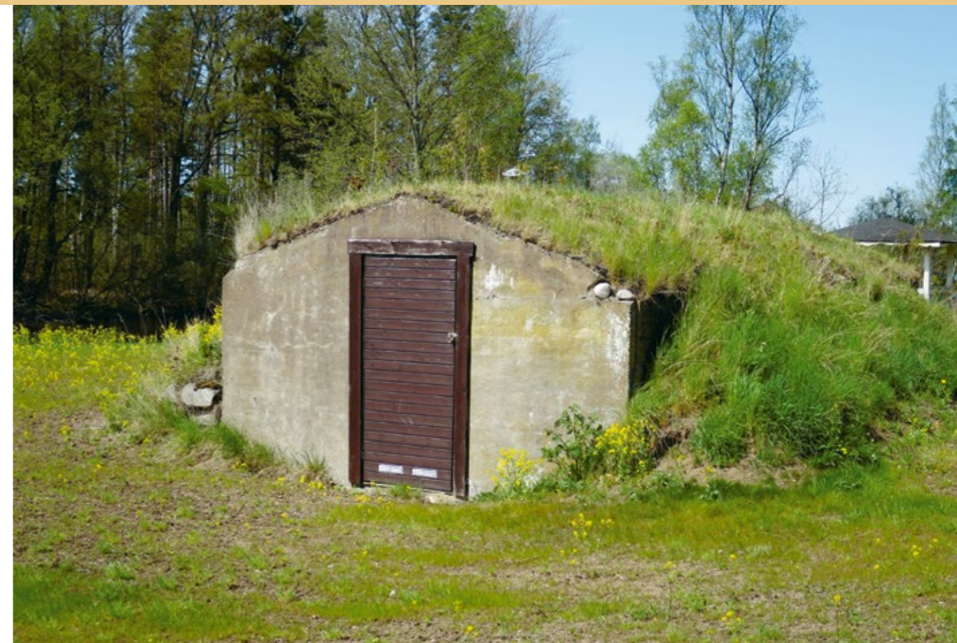
Källare som tillhört stationsmiljön.

Stationshuset.