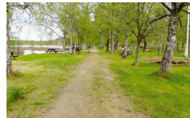
Banvallen mot norr.

Äldre glasbruk anlades vid vattendrag eftersom man behövde vattenkraft till sliperiet. Med tiden blev etableringen av järnvägen en allt viktigare faktor. De glasbruk som inte låg vid järnväg eller dit bruket själv inte kunde bekosta ett stickspår var de som först fick svårt att överleva. Järnvägsstationer blev en viktig del av bruksorterna. Målerås, Skruf och Hovmantorp är exempel på glasbruksorter som anlades vid järnvägen.