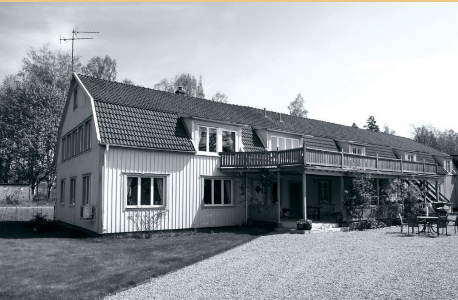
Magasinet och brukskontoret.