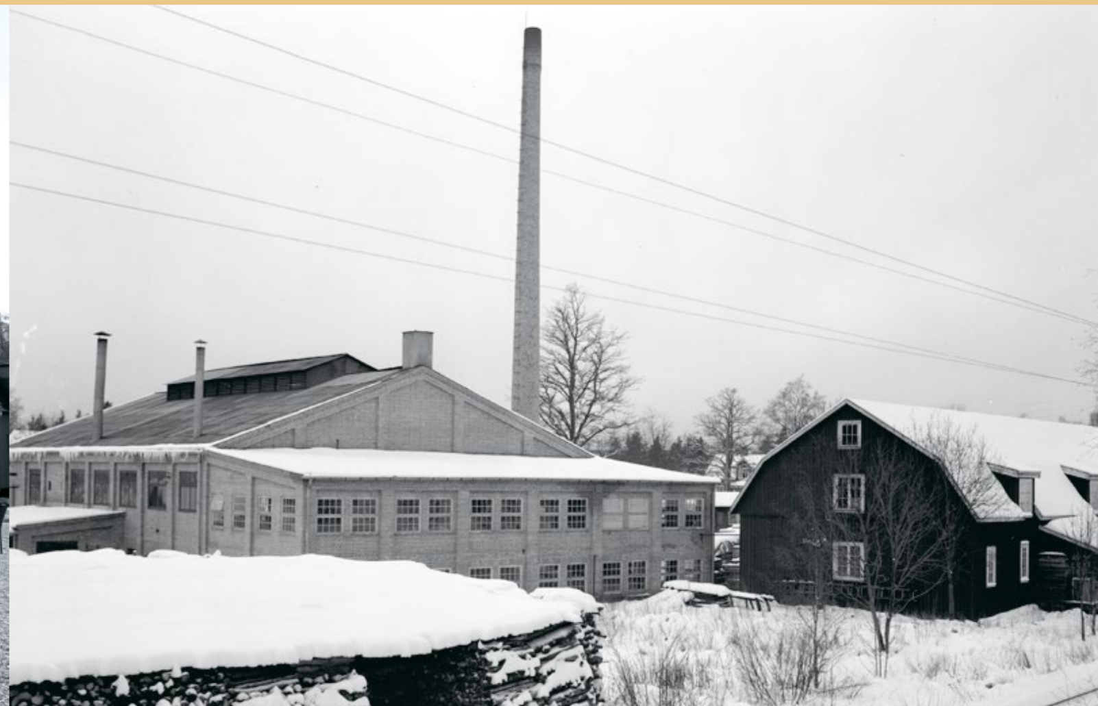
Björkshults glasbruk 1950.

Husets bottenvåning fungerar idag som samlingslokal.