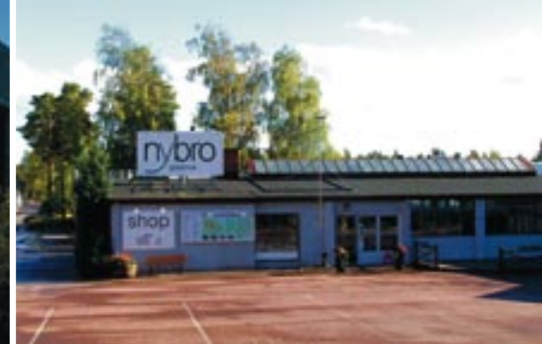
Tv. Cementgjuteriet. Th. Glasshopen idag.