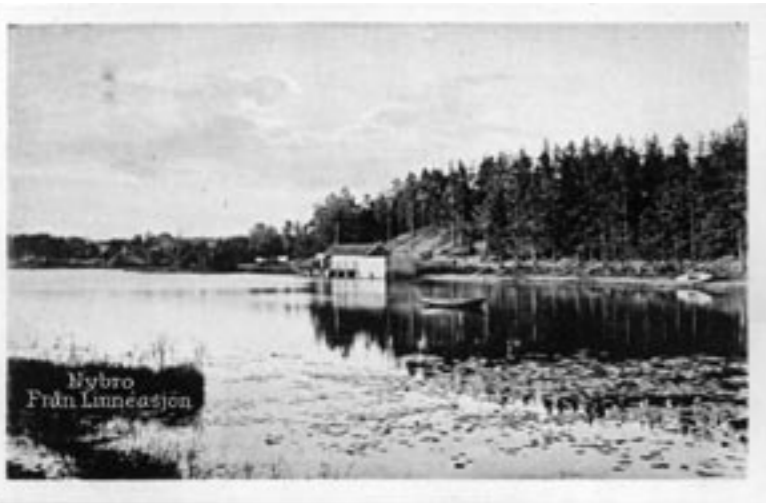
Vykort; Linneasjön med badhus som fanns under brunnsepoken.