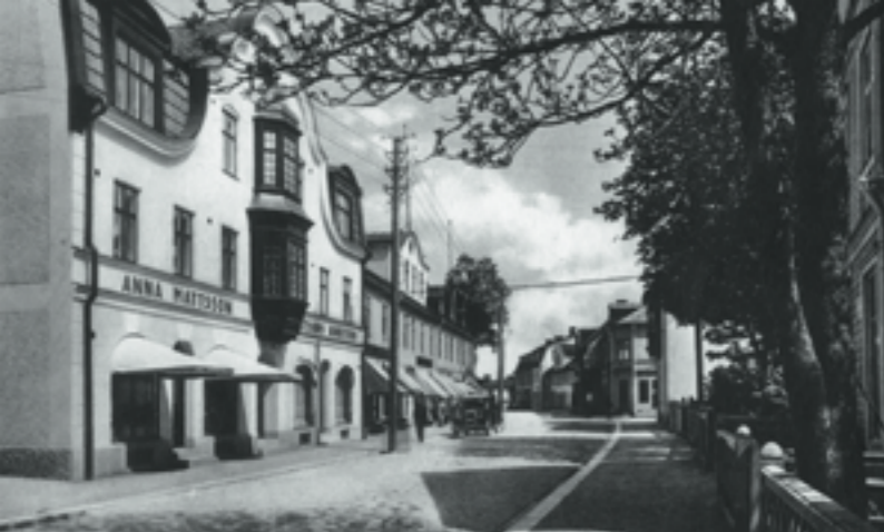
Storgatan med sina fina Jugendhus följer den gamla landsvägen. Th. Vykort; Stora Hotellet och Stadshuset i den nyblivna staden Nybro, 1935.