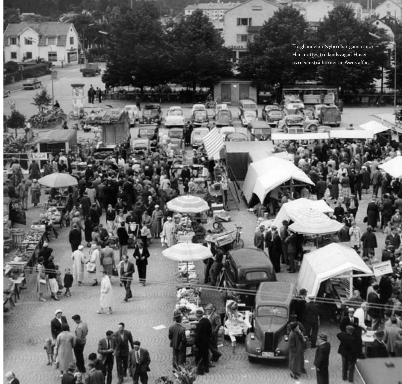
Torghandeln i Nybro har gamla anor. Här möttes tre landsvägar. Huset i övre vänstra hörnet är Awes affär.