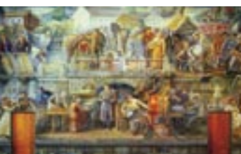
Frescomålning i Stadshuset av nybrosonen Gunnar Theander.

Under 1800-talet växte ett stort antal brunnsorter fram i Sverige, såväl längs kusterna som i inlandet, med både inhemska och utländska förebilder. Grunden var att man kunde bota sjukdomar genom att dricka hälsosamt mineralvatten, bada hälsobad och andas frisk luft. Brunn- och badanstalten här i Nybro startade 1883 och kom sedan att drivas av kommunen ända fram till 1949 under namnet Nybro Brunn och Badanstalt. Den var typisk för en inlandskurort i Sverige, men hade också fördelen av goda kommunikationer i och med järnvägen som anlades 1874. Kurorterna kom tidigt att utvecklas till miljöer för rekreation och tidvis intensivt nöjes- och sällskapsliv, främst för överklassen. Nybro kallvattenkuranstalt AB som bildats 1881 marknadsförde Nybro på följande sätt: " ...Nybro köping åtnjuter, att jämte ett torrt och sunt läge på en högt liggande grusslätt med frisk doftande barrluft från omgivande furuskogar, inom sitt område äga en ovanligt rik tillgång på klart, gott och kallt källvatten ... lämpa sig synnerligen väl för anläggande av en kallvattenkuranstalt i förening med