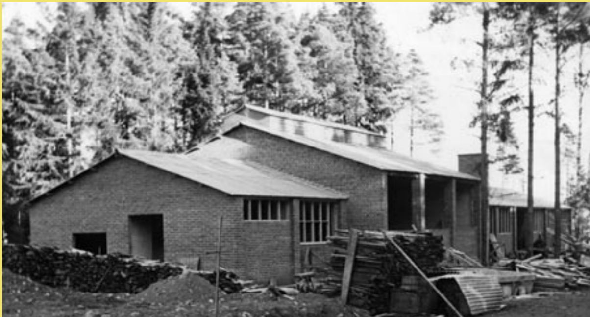
Den nya hyttan under uppbyggnad 1946.

I slutet av 1960-talet blev armaturindustrin en allt viktigare kund och under tidigt 1970-tal startades tillverkning av glashandtag till köksluckor. Bruket lät mura upp två mindre vagnar enbart för detta ändamål och vid samma tid började efterfrågan på tidigare produkter att minska allt mer. Tidigare stora kunder köpte in motsvarande produkter i lågprisländer. Firmanamnet ändrades till AB Nybro Glasbruk.