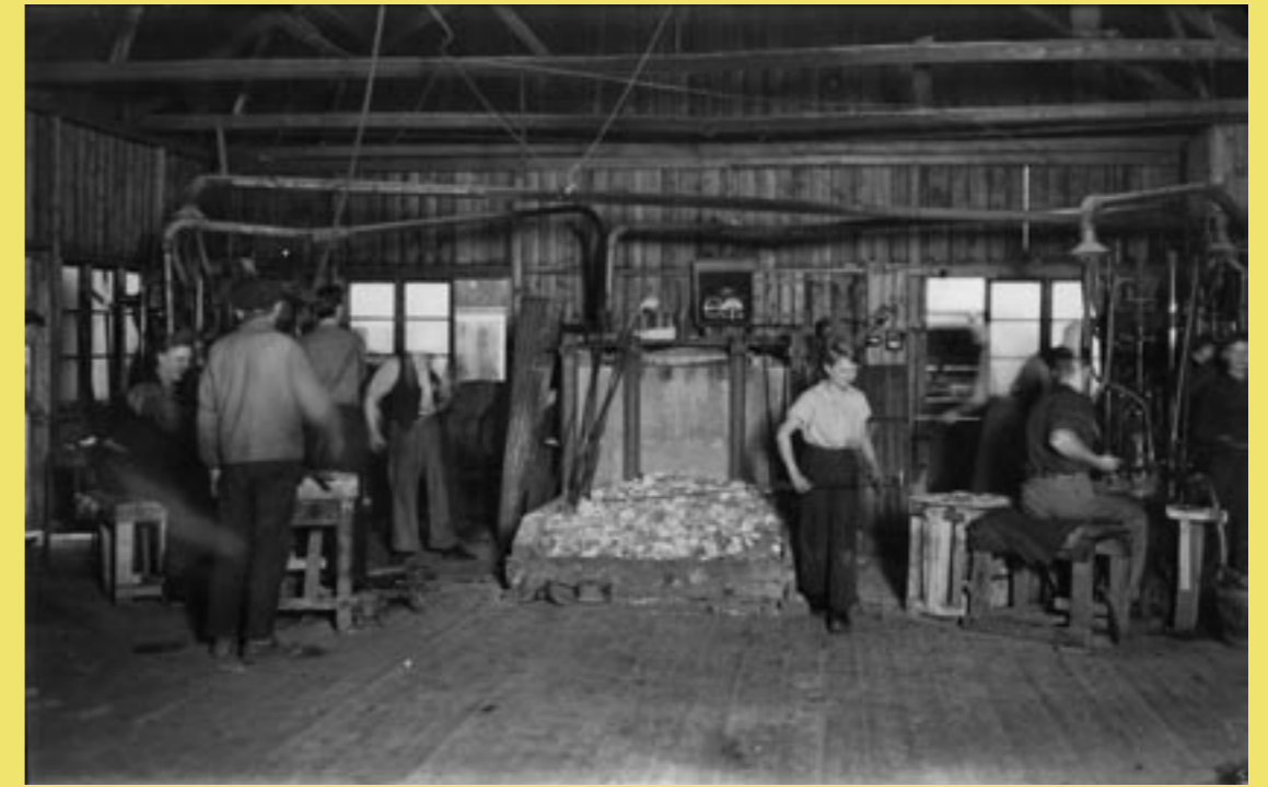
Gamla hyttan i Emmatorp.

”Flygsfors glasbruk gjorde burkarna och Mellströms hytta locken. Jag har varit med om att göra miljontals lock...”