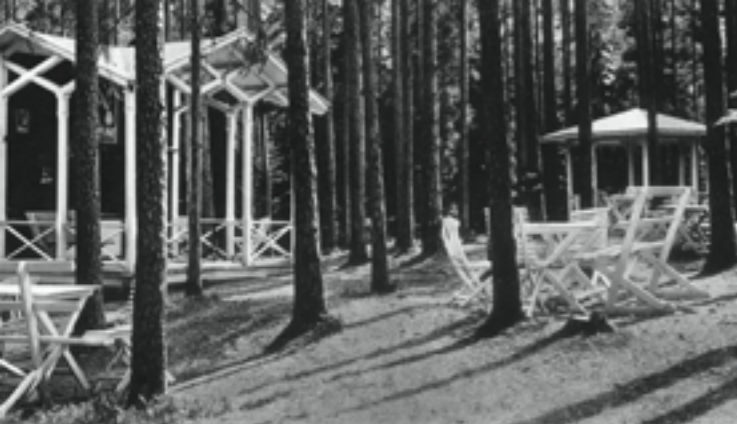
Skogspaviljongen och musikestrad. Th. Ljungdahls gamla kuvert fabrik.