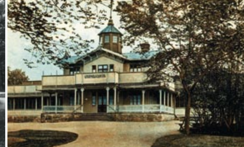
Tv. Brunnsparken med sina planteringar och gångar från början av 1900-talet. Th. Varmbadhuset som idag är borta.

las den Nybrojugend. Karaktäristiskt är bågformerna och ornamentik med blad och blommor.