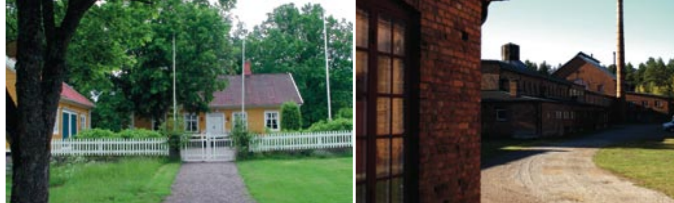
Tv. Qvarnaslätts hembygdsgård. Th. Pukebergs glasbruk

Från parken går vi längs maden till vår lilla sjö, Linnéasjön, som tidigare hette Qvarnaslätsgölen men som döptes om sedan man hittat Linnéa borealis vid stranden. Tag den vackra promenadstigen under tallarna mellan vattnet och åsen. Längs stigen vid sjön kan du se några trappor ner mot