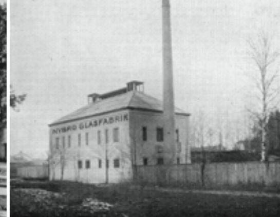
Tv. Gammalt vykort av stationshuset. Th. Engshyttan var strategiskt placerad vid ån och järnvägen.

järnvägsknut 1874 hade avgörande betydelse för samhällets utveckling. Idag är det många som pendlar till Kalmar, Emmaboda och Växjö. Det finns också direkttåg till Köpenhamn. I början av 1980-talet användes stationsmiljön för inspelning av tågscenerna i den omtyckta filmen "Mitt liv som hund". Huvuddelen av filmen spelades in i Åfors glasbruksmiljö, men också i Stockholm och Kalmar. Förebilden för författaren Reidar Jönsson var glasbruksorten Boda.