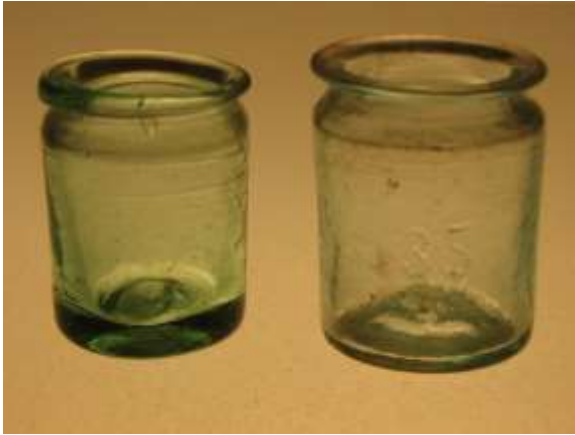
Salveburkar från Hovmantorps första glasbruk.