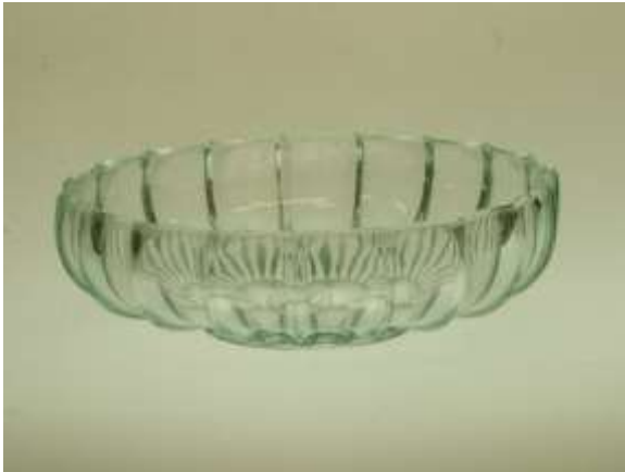
Grand, Hofmantorps Nya Glasbruk.