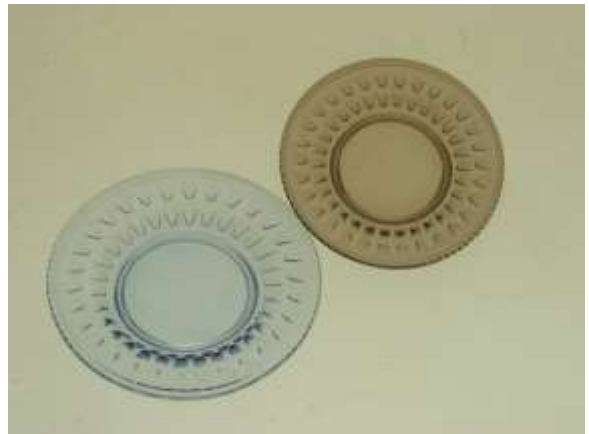
Åssietter ritade av Edvard Hald från Orrefors glasbruk.