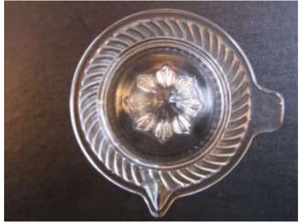
Citronpress enligt uppgift från Transjö glasbruk.