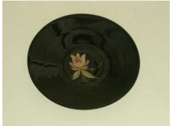
"Diesners ros", Åfors glasbruk.