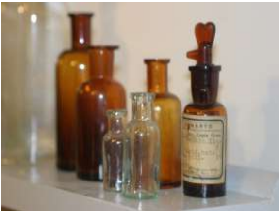
Apoteks- och medicinglas. Många bruk tillverkade dylikt, bl.a. Björkå, Limmared, Kungälv m.fl.