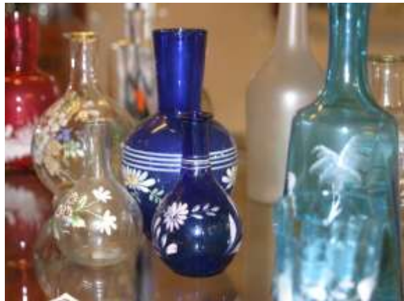
Oidentifierade vattenkaraffer från flera bruk – 1800-tal.