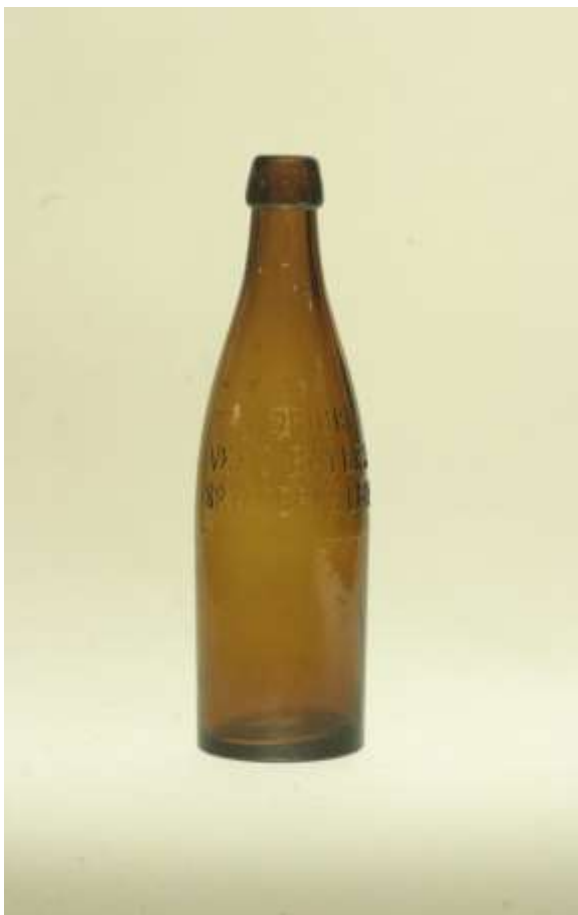
Ölflaska 1/3-LIT. s.k. knoppis. Blåst vid Borensbergs glasbruk I glaset står i reliefen "DRICK VEXIÖ BAYERSKA BRYGGERI'S LAGERÖL".