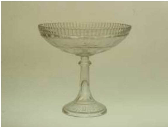
Kompottskål från Kosta glasbruk.