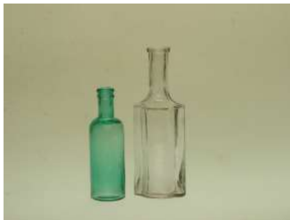
Sekelskifte 1800-1900 Soyafaska och Eau de Cologne-flaska. Båda troligen från Limmared.