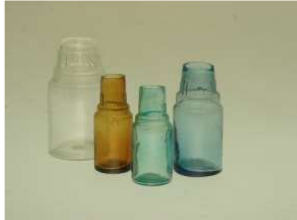
Syndetikonburkar, Limnareds glasbruk.