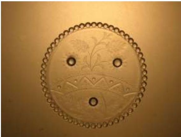
Assiett från Transjö glasbruk, så kallad "Prästatallrik".