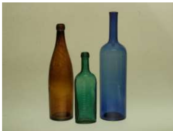
Ölflaska 2/3-LIT. Ronneby arsenikvatten 200 gram. Hårvattenflaska.