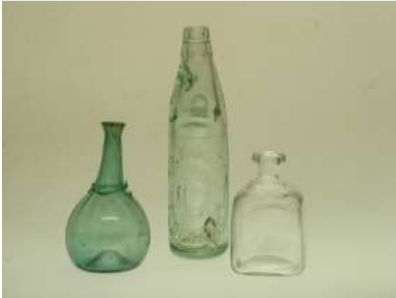
Elevarbete "söl". Engelsk "kulflaska". Brännvinskaraff.